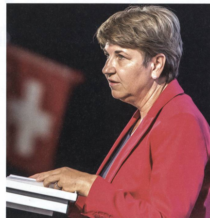
Bundesrätin Amherd: «Der F-35A ist das am besten für die Schweiz geeignete Flugzeug».