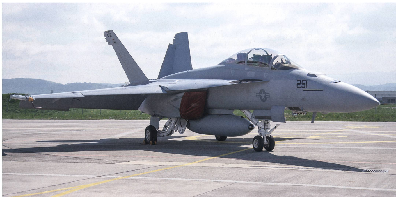
F/A-18 Super Hornet, Boeing.

Unter dem Titel «Welchen Einfluss hat [sic] die USA?» wird vom Datenaustausch gewarnt. «Mit der stark ausgebauten Kommunikation zwischen verschiedenen militärischen Systemen besteht die Gefahr, dass die Schweizer Flugzeuge in Zukunft nicht nur zum Schutz des Schweizer Luftraums eingesetzt würden», lautet das vollständige Argument. Die beschriebene Verbindung trifft allerdings auf jedes