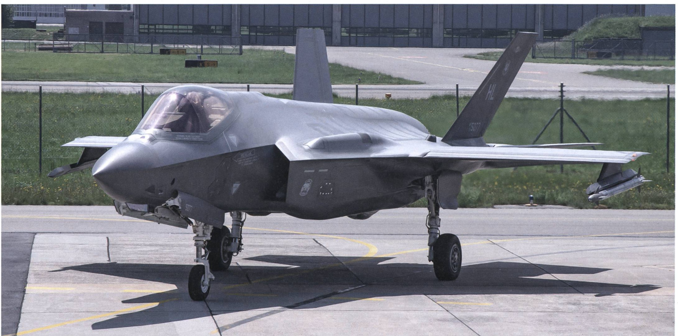
F-35A, Lockheed Martin.