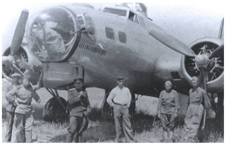
Russische Soldaten vor einer beschädigten B-17 auf dem Flugplatz Poltawa.

Italien eingesetzt und die Pendelangriffe verlieren ihre ursprüngliche strategische Relevanz. Bei den von Jagdbombern angegriffenen Zielen handelte es sich unter anderem um Eisenbahnanlagen in Rumänien. Die Analyse der Angriffe ergibt, dass der Aufwand in einem schlechten Verhältnis zur erzielten Wirkung ist. Es werden keine Frantic-Jagdbombereinsätze mehr durchgeführt. «Frantic V» und «VI» werden wieder durch die 8th AF und mit Langstreckenbomben aus Grossbritannien lanciert.