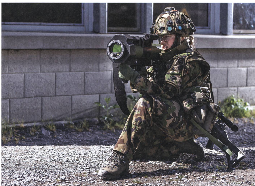
Mit neuen Simulatoren kann der Kampf mit den neuen schultergestützten Mehrzweckwaffen trainiert werden.

Mit dem Rüstungsprogramm 2016 wurden schultergestützte Mehrzweckwaffen in drei Ausführungen beschafft. Sie erlauben es, den Gegner auf kurze und mittlere Distanz