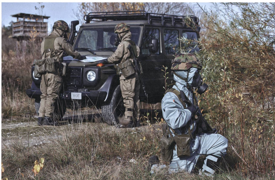
Das persönliche ABC Schutzmaterial wird modernisiert.