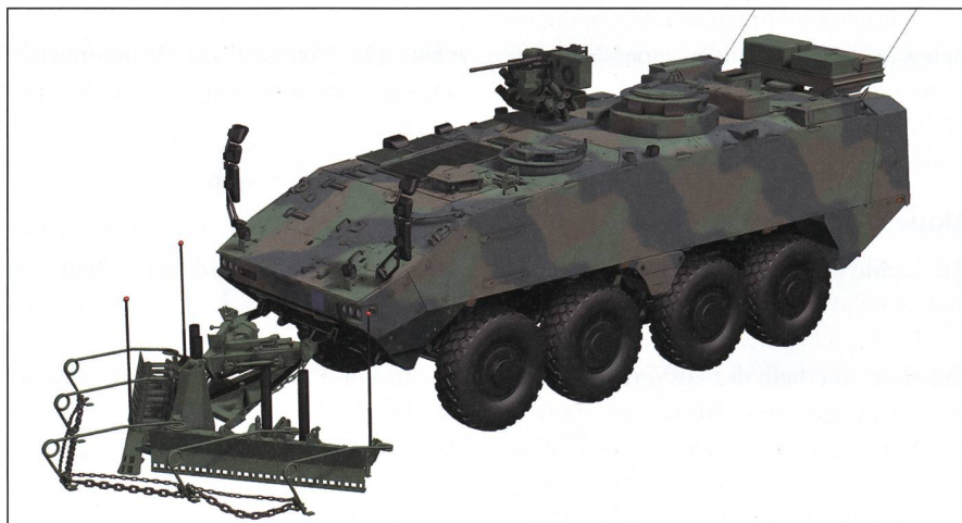
Die Panzersappeure erhalten ein neues Fahrzeug des Typs Piranha IV.

Heute verfügt die Armee über 5000 1-achsige Anhänger. Mehr als die Hälfte stammt