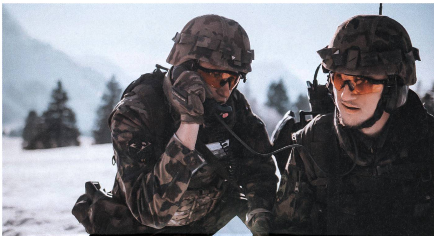
Das Infanteriebataillon 61 ist eines von zwei Infanteriebataillonen der Schweizer Armee, welche seit 2018 eine Unterstützungsfunktion innerhalb der Territorialdivision 4 ausüben.

Fachof Thierry Meister (Text)