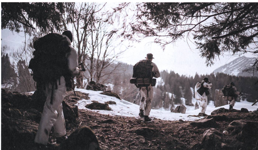
Trotz Auflagen konnte ein erfolgreicher WK durchgeführt werden.