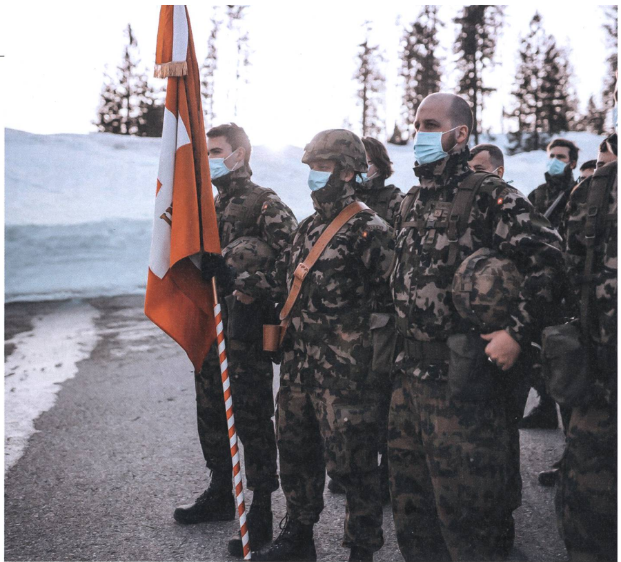
Um zu erfüllen, musste ein gemeinsamer «esprit de corps» entwickelt werden.