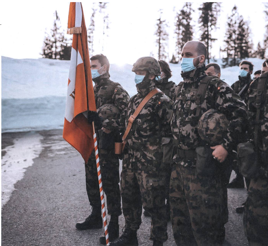
Um zu erfüllen, musste ein gemeinsamer «esprit de corps» entwickelt werden.