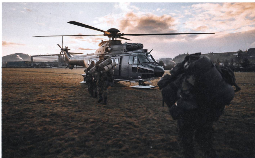
«Göttikanton» des Infanteriebataillons 61 ist der Kanton Schaffhausen.

Die U SENTIERO schuf am nebelverhangenen ersten WK-Samstag gemeinsa-