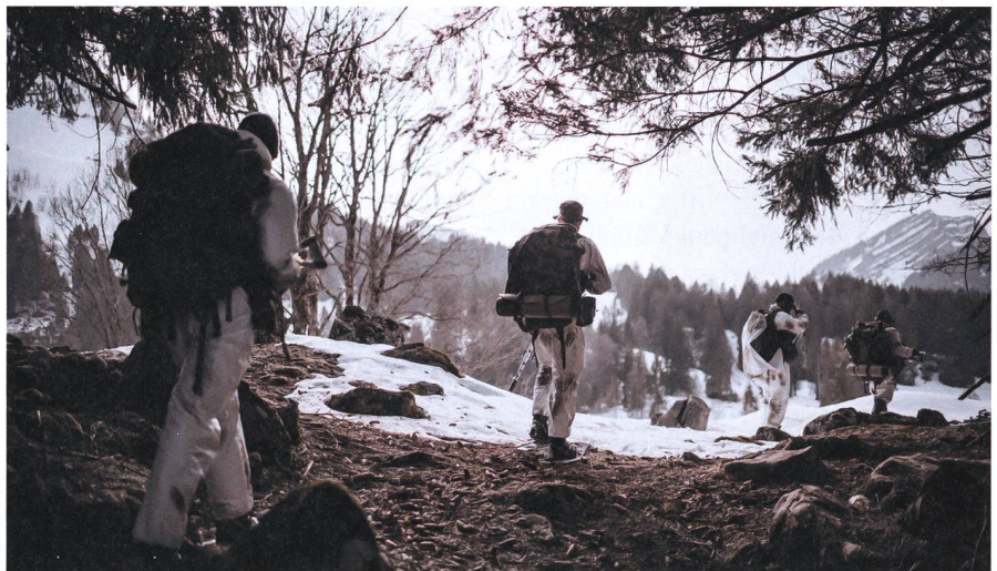
Trotz Auflagen konnte ein erfolgreicher WK durchgeführt werden.