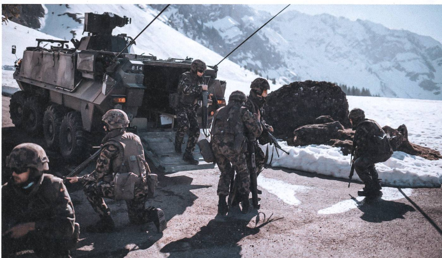
Keine Selbstverständlichkeit: Die Truppe leistet auch in einer schwierigen Lage einen wichtigen Beitrag zur Schweizer Sicherheit.