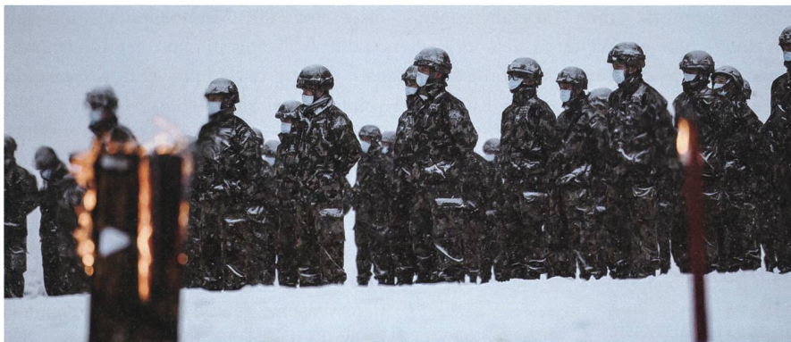
Im Dienst sah sich das Bataillon nicht mit den Habsburgern, sondern mit einem anderen Gegner konfrontiert: COVID-19.

Vor 700 Jahren war die WK-Region in der Zentralschweiz Schauplatz der Schlacht am Morgarten. Zu jener Zeit haben die alten Eidgenossen das Habsburger Heer von Herzog Leopold I. aus einem Hinterhalt angegriffen und vernichtet. Ein triumphaler Sieg der «wehrlosen» Eidgenossen über die Habsburger, der ein wichtiger Meilenstein in der Geschichte der Schweizerischen Eidgenossenschaft darstellt.