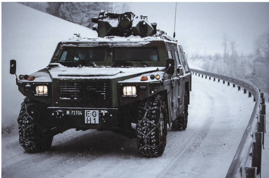
Ein Aufklärungsfahrzeug «Eagle» in der verschneiten WK-Region, die vor 700 Jahren Schauplatz der Schlacht am Morgarten war.