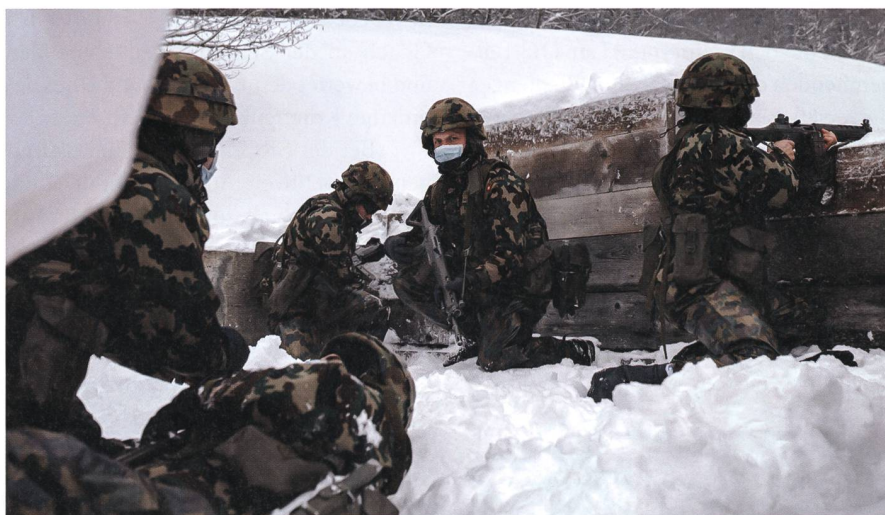
Das Bataillonsmotto des Aufkl Bat 11 lautet: #gemeinsamstark.