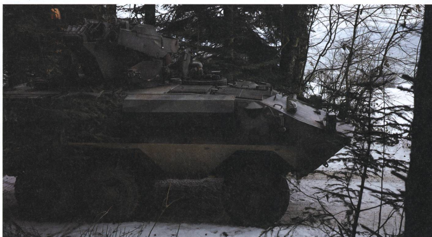
Ein Panzerjäger aus einer der beiden Aufklärungskompanien. Aufgrund der tiefen Personalbestände wurde die dritte Aufklärungskompanie aufgeteilt sowie Stabs- und Logistikkompanie fusioniert.