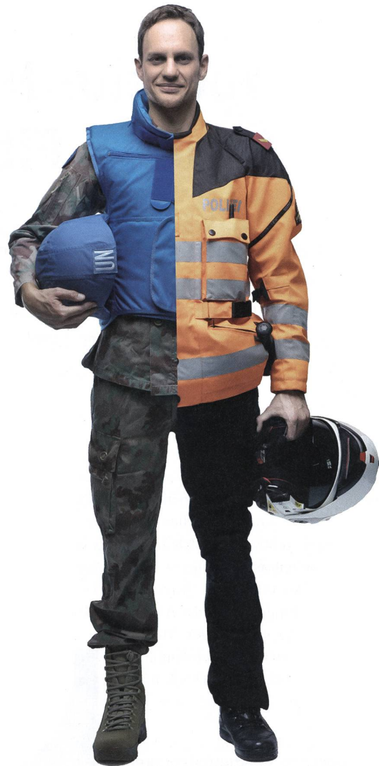
Der Militärdienst im Allgemeinen ermöglicht es insbesondere den Kaderangehörigen, sich bei der Bearbeitung von komplexen militärischen Fragestellungen zu bewähren.