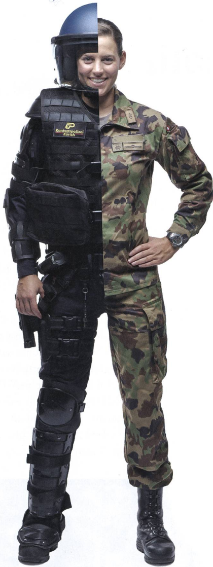
Aktuell leisten rund 60 Korpsangehörige der Kapo Zürich Dienst in der Schweizer Armee.