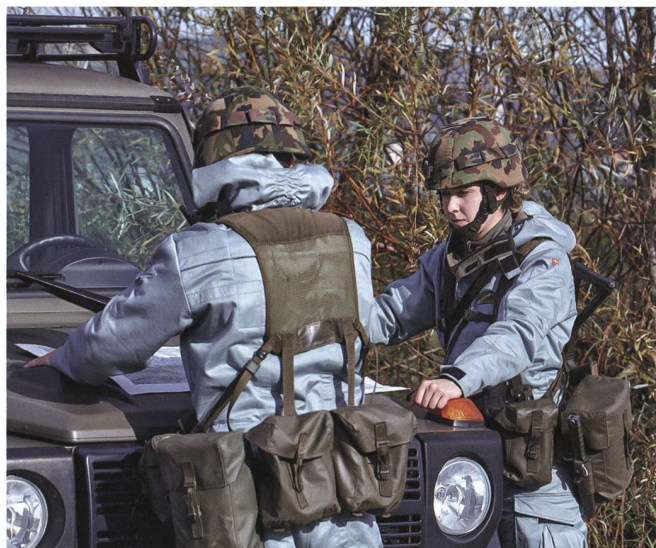
Neue individuelle ABC-Schutzanzüge.