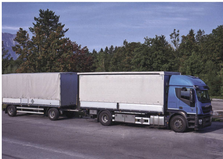
1- und 2-achsige Anhänger für Lastwagen.