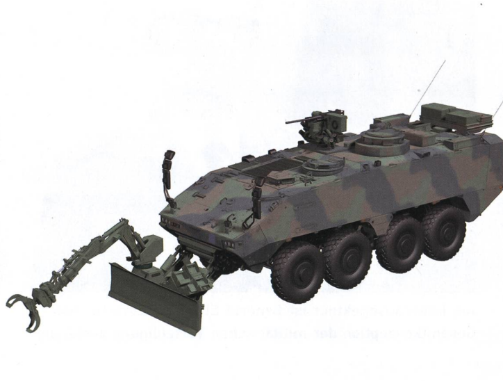
Erneuerung der Fahrzeuge für Panzersappeure. Vom M113 zum Piranha IV.