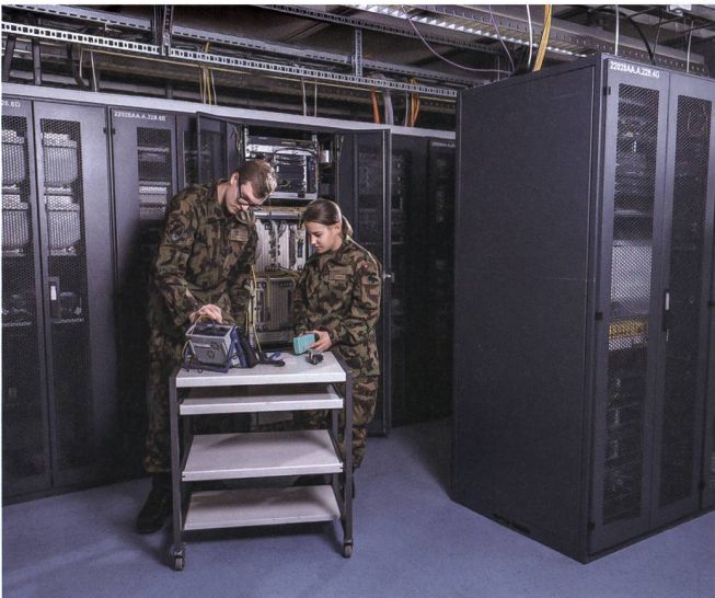
Ausbau des Führungsnetzes Schweiz & Ausstattung der Rechenzentren VBS.