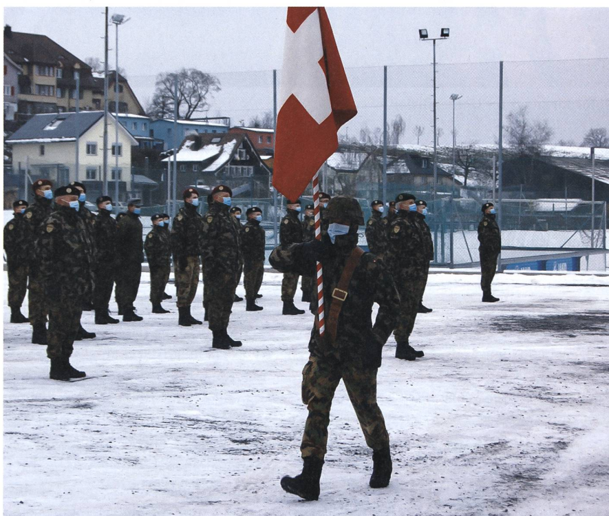
Dem kalten Wetter zum Trotz.