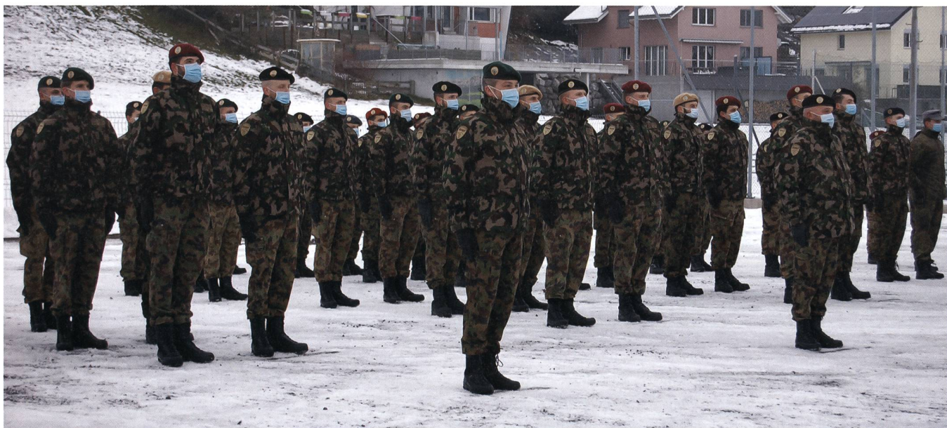
Die Teilnehmer sind angetreten.

Sie dankt dem Kommandanten der BUSA für seine Worte und gratuliert den zukünftigen Berufsunteroffizieren (BU) des GAL 21/22 zu ihrem Entscheid. Weiter dankt sie den Absolventen des GAL 20/21 für