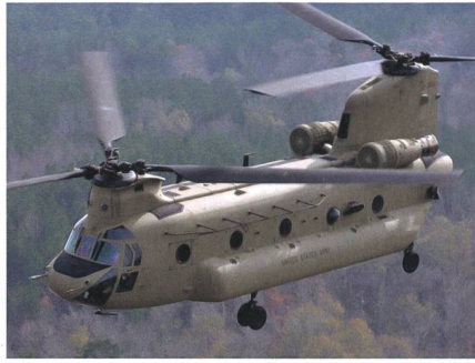
CH-47F für die Luftwaffe von Singapur.

Die Republic of Singapore Air Force hat mit der Abnahme ihrer neuen Transporthelikopter CH-47F begonnen, der nach und nach die älteren Chinooks der RSAF ersetzen sollen. Die CH-47F sind mit