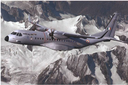
Airbus C295 für die indische Luftwaffe.

Indien hat mit dem europäischen Flugzeugbauer Airbus einen Vertrag über den Kauf von 56 Airbus-C295-Maschinen zur Modernisierung der Indian Air Force (IAF) abgeschlossen. Der Vertrag sieht eine Lieferung der ersten 16 voll einsatzfähigen Flugzeuge von der Airbus-Endmontagelinie im spanischen Sevilla aus vor, schreibt das Unternehmen in einer Mitteilung. Die folgenden 40 Flugzeuge würden dann im Rahmen einer Industriepartnerschaft mit Airbus von Tata Advanced Systems (TASL) in Indien gefertigt und montiert. Den Angaben von Airbus zufolge handelt es sich um das erste «Made in India»-Programm und umfasst die Ent-