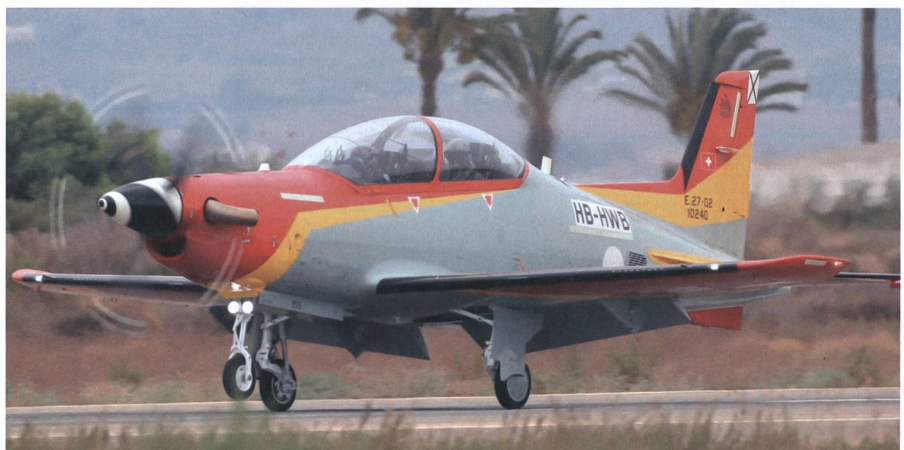
Auslieferung der LC-21 an Spanien.