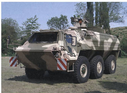
Bundeswehr will ABC-Spürpanzer Fuchs modernisieren.

Die modernste Version Fuchs IA8 gewährleistet gegenüber älteren Modellen einen erheblich verbesserten Schutz vor Minen und Sprengfallen, gleichzeitig wurde der ballistische Schutz der Fahrzeuge erhöht. Zu den wesentlichen Modifikatio-