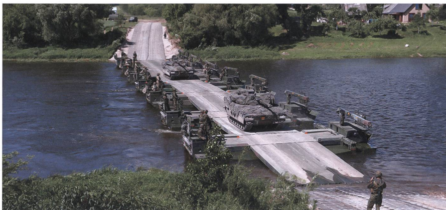
System M3: Als Brücke oder mehrteilige Fähre einsetzbar.

GDELS bezeichnet M3 als «das weltweit schnellste und leistungsfähigste amphibische Brücken- und Fährsystem in