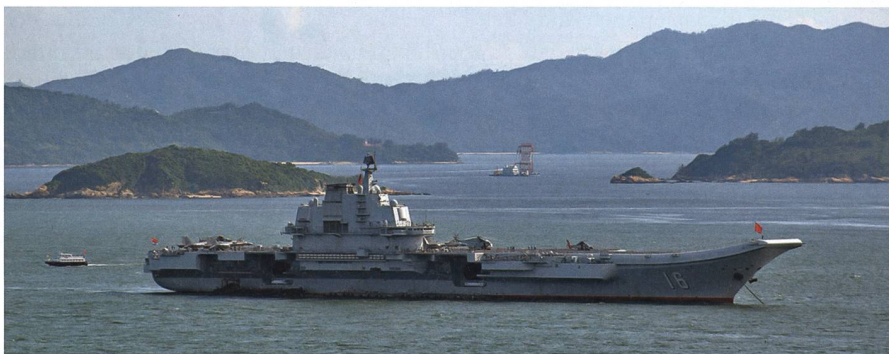
Der Flugzeugträger Liaoning in Hong Kong. Er ist mit einer Rampe als Startvorrichtung ausgestattet.