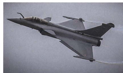
Griechenland erhält sowohl Doppel- als auch Einsitzer-Varianten des Kampffjet Rafale.

Die Griechische Luftwaffe kauft zusätzlich sechs weitere Kampfflugzeuge vom Typ Rafale des Herstellers Dassault. Athen bestellte bereits im Januar 18 Maschinen.