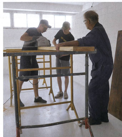
Generationenübergreifend packen die Mitglieder und Gönner auf der Mammutbaustelle mit an.

Uniformen, Lederzeug und Bewaffnung, kleine, feine Zinnfiguren, der umfassende Fuhrpark, Archivbestände und Bilder. Das umfangreiche Vereinsmaterial ist am neuen Standort angekommen. Nun ist es an der Zeit, wieder Ordnung in die Sammlung zu bringen.