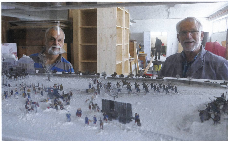
Hunderte kleiner Zinnfiguren müssen in mühevoller Arbeit wieder zu den Szenarien (etwa Bourbaki) aufgebaut werden, in welchen sie bereits im Zeughaus Uster zu bewundern waren.

bewältigt, das Packen des Materials organisiert, die Transporte durchgeführt. Am neuen Standort zuerst Platz geschaffen, entsorgt, gereinigt, Material aufgetürmt, Gestelle eingebaut, Kammer um Kammer entwickelt.