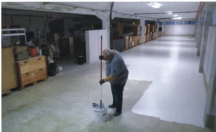
Alleine aber nicht einsam: Während hier in diesem Raum der Boden neu gestrichen wird, wird in den anderen Räumlichkeiten ebenfalls hart gearbeitet.

Neben der harten körperlichen Arbeit sind wir auch dankbar für jede finanzielle Zuwendung. Denn so ein Neustart kostet nicht nur Kraft und Nerven, sondern auch viel Geld.