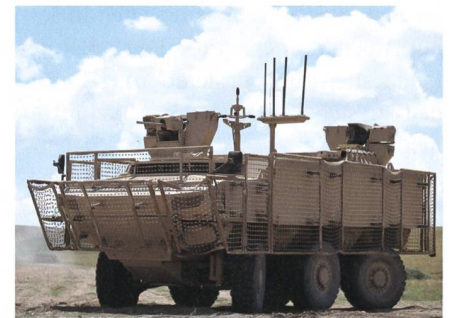
Spezialkräfteversion des FNSS 6x6 Pars IV.

Bei der International Defence Industry Fair (IDEF) in Istanbul, stellte der türkisch/britische Militärfahrzeughersteller FNSS Defence Systems aus der Radpanzerbaureihe Pars (Leopard) eine Version für Spezialkräfte vor. Wie FNSS mitteilt, hat das Präsidium der Verteidigungsindustrie (SSB) das minengeschützte 6x6 Pars IV SOV (Special Operations Vehicle) bestellt, das derzeit Qualifizierungstests unterzogen wird. Das allradgetriebene und an Vorder- und Hinterachse lenkbare 26-Tonnen-Fahrzeug wird von einem Euro-III-Dieselmotor angetrieben, dessen Leistung auf rund 400 kW geschätzt wird. Automatisches Getriebe und hydropneumatische Einzelradaufhängung sind weitere mobilitätsbestimmende Merkmale. Neben Fahrer und Kommandant sind mindestens zwei Bediener für die beiden unabhängigen fernbedienbaren Waffenstationen erforderlich. Verfügbare Bewaff-