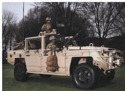
Spezialkräfte-Fahrzeug von DEFENTURE.

Diese Plattform wird beispielsweise auch von den niederländischen Korps Commandotroepen (SOF) und anderen Ländern genutzt. Der modulare Aufbau der allradgetriebenen, hochmobilen Fahrzeuge ermöglicht eine optimale Vorbereitung auf den jeweiligen Einsatzzweck. Die Deutschen wollen ein Mittleres Aufklärungs- und Gefechtsfahrzeug Spezialkräf-