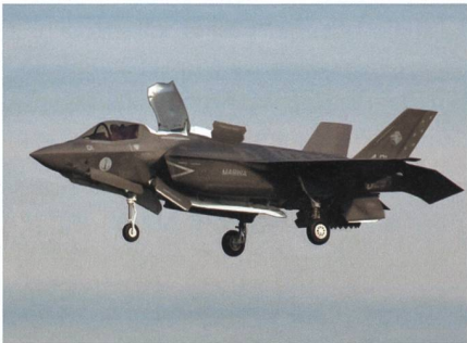
F-35B der italienischen Marina Militare.

Ende Juli ist zum ersten Mal eine F-35B Lightning II der Marina Militare auf dem italienischen Flugzeugträger Cavour gelandet. Für die italienischen Seestreitkräfte war dies ein bemerkenswertes Ereignis, da zum ersten Mal eine im eigenen Land gebaute F-35B der Marina Militare auf dem Flugzeugträger Cavour gelandet ist. Bislang hatte der italienische Flugzeugträ-