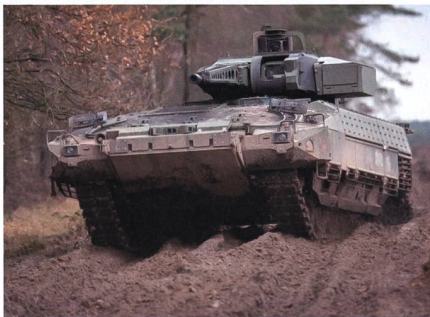
Der Schützenpanzer Puma wird Kampfwert gesteigert.

Die Schützenpanzer (SPz) Puma werden zum Konfigurationsstand S1 nachgerüstet. Ein Vertrag über die Umrüstung eines ersten Loses hat ein Volumen von einer Milliarde Euro; für die Umrüstung eines zweiten Loses mit 143 Puma wurden als Option 820 Millionen Euro vereinbart. Die Umrüstung des ersten Loses soll bis 2026, die des zweiten Loses bis 2029 abgeschlossen werden. Für die NATO-Speerspitze VJTF 2023 werden 40 Schützenpanzer Puma frühzeitig umgerüstet. Die neue Puma-Version S1 zeichnet sich