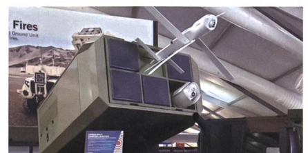
Hero 120 Loitering Munition für das U.S. Marine Corps.