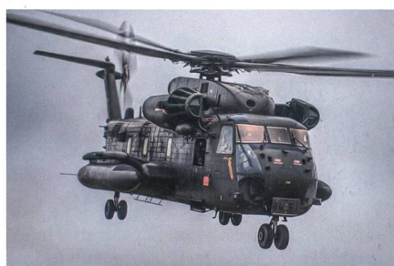
CH-53G der Bundeswehr.

Die Luftwaffe hat in Laupheim die ersten CH-53GS Obs erhalten, welche bei Airbus Helicopters in Donauwörth modernisiert wurden. Insgesamt sollen an 20 CH-53GS und an sechs CH-53GE nicht mehr lieferbare Bauteile ersetzt werden. Laut Vertrag vom 17. Februar 2017 soll dies 135 Millionen Euro kosten. Der damalige Plan sah die Umrüstung aller Maschinen bis 2022 vor, die dann bei Bedarf bis 2030 in Dienst bleiben können. Von der Obsoleszenzbeseitigung betroffen sind insbesondere die Bereiche Flugregelanlage (neuer Autopilot), Avionik (Bildschirme im