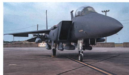
F-15E Strike Eagle mit fünf AGM-158 JASSM.