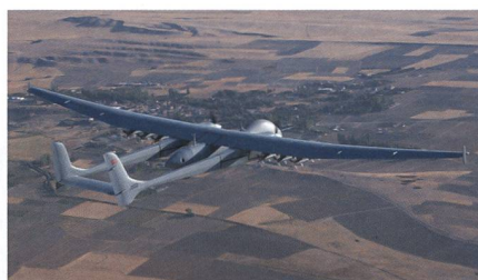
Bewaffnete Aksungur-Drohne von TAI.

Die von Turkish Aerospace entwickelte Aksungur-Drohne hat mit einer Lenkbombe ein Ziel aus 30 Kilometern Entfernung getroffen. Nach dem Start vom TAI-Hauptwerk bei Ankara flog die zweimotorige Aksungur etwa 300 Kilometer in die Nähe von Sinop an der Schwarzmeerküste und warf aus 6000 Meter Höhe die mit