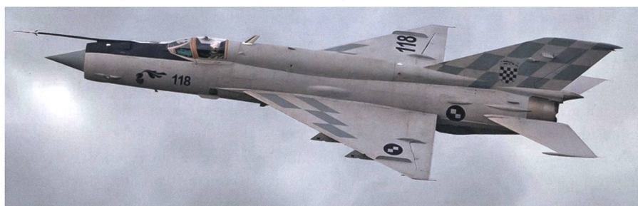
MiG-21 der Kroatischen Luftwaffe.

Kroatien hat sich für die Beschaffung von zwölf Rafale entscheiden und ersetzt damit ihre MiG-21. Zehn gebrauchte Einsitzer und zwei Doppelsitzer-Rafale im F3R Standard sollen ab 2024 nach Kroatien geliefert werden, um dann die MiGs abzulösen. Die erste Tranche wird sechs Flugzeuge umfassen. Gemäss kroatischen Quellen soll der Preis für das Dutzend Rafales 999 Millionen Euro betragen. Als MiG-21-Nachfolger bewarben sich auch die USA mit neuen F-16 und gebrauchten