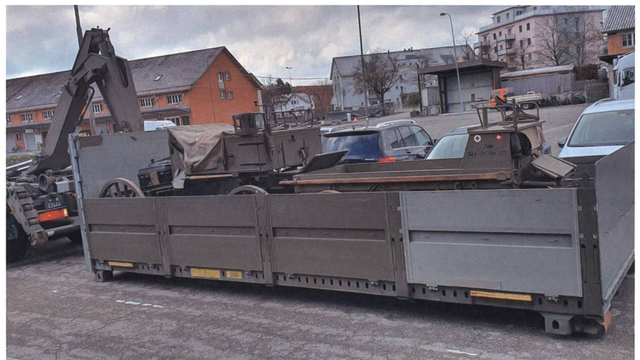
Der Fahrzeugpark wurde verschoben.

Ich entschuldige mich für diesen klei- nen aber doch bedeutenden Fehler.