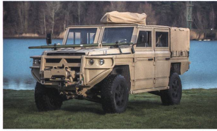
Prototyp des LAUF 20 für das KSK.

Die Schweizer Armee sucht für ihre Spezialkräfte einen Nachfolger für das 2007 eingeführte leichte Aufklärungs- und Unterstützungsfahrzeug (LAUF). In diesem Frühjahr hat das niederländische Unternehmen Defenture einen Prototyp LAUF 20 an die Beschaffungsbehörde armasuisse geliefert. LAUF 20 basiert auf dem Groundforce-Fahrzeug GRF, das Defenture nach dem Bedarf der Spezialkräfte von Heer und Marine der niederländischen Streitkräfte entwickelt hat und wel-