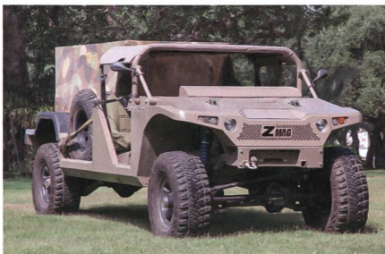
Neues taktisches Geländefahrzeug Z-MAG für die israelischen Streitkräfte.

Das israelische Verteidigungsministerium beschafft taktische Fahrzeuge des Typs Z-MAG, wie aus einer Mitteilung des israelischen Rüstungskonzerns Israel Aerospace Industries (IAI) hervorgeht. Neben den Fahrzeugen für die israelischen Streitkräfte soll der Vertrag auch Z-MAGs für einen ausländischen Kunden beinhalten. Z-MAG ist ein All-Terrain Vehicle (ATV), ursprünglich entworfen von Zibar aus Israel. Den Angaben des Herstellers zufolge ist