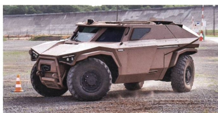
Aufklärungsfahrzeug Arqus Scarabée.

Damit kann das Fahrzeug gleichzeitig von den Vorzügen des Elektromotors (hohes Anfahrtdrehmoment, leise, geringe Wärmeabstrahlung) und des Verbrennungsmotors (Dauerbetrieb, grosse Reichweite, schnelles Auftanken) profitieren. Der Scarabée kann sich also mit einer spezifischen Leistung von 36 kW/Tonne über grosse Entfernung schnell annähern und im Einsatzgebiet nahezu geräuschlos operieren. Der Energievorrat der Batterie erlaubt den Betrieb der Aufklärungs- und Kommu-