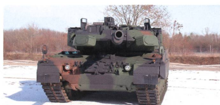
Leopard 2 mit Trophy-Schutzsystem.

Die Verträge über den Einbau der aktiven Schutzsysteme Trophy in den Kampfpanzer Leopard 2 sind Anfang Jahr abgeschlossen worden. Dies teilten Bundesamt für Ausrüstung, Informationstechnik und Nutzung der Bundeswehr (BAAINBw) und die beteiligten Firmen Rafael (für die Lieferung der Schutzsysteme) und Krauss-