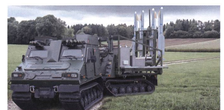
IRIS-T SLS auf Hägglunds BV-410.