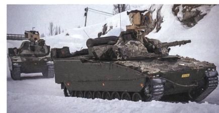
CV9030 der norwegischen Streitkräfte.

Das norwegische Heer erhält bis 2023 zwanzig zusätzliche Schützenpanzer CV90. Zwölf werden als Pionierpanzer geliefert und acht als Mehrzweck-Transportpanzer. Norwegen hat dafür aus Mitteln zur Bewältigung der Corona-Krise umgerechnet rund 45 Millionen Euro bereitgestellt, die vorwiegend norwegischen Unternehmen zugutekommen sollen. Daher bindet der Hauptauftragnehmer BAE Systems Hägglunds bis zu 30 norwegische Zulieferer in die Auftragsdurchführung ein. Mit den zwanzig weiteren Schützenpanzern wächst die CV90-Flotte in Norwegen