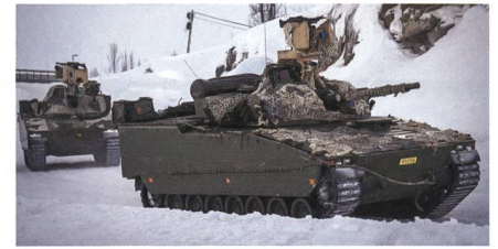
CV9030 der norwegischen Streitkräfte.

Das norwegische Heer erhält bis 2023 zwanzig zusätzliche Schützenpanzer CV90. Zwölf werden als Pionierpanzer geliefert und acht als Mehrzweck-Transportpanzer. Norwegen hat dafür aus Mitteln zur Bewältigung der Corona-Krise umgerechnet rund 45 Millionen Euro bereitgestellt, die vorwiegend norwegischen Unternehmen zugutekommen sollen. Daher bindet der Hauptauftragnehmer BAE Systems Hägglunds bis zu 30 norwegische Zulieferer in die Auftragsdurchführung ein. Mit den zwanzig weiteren Schützenpanzern wächst die CV90-Flotte in Norwegen