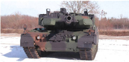
Leopard 2 mit Trophy-Schutzsystem.

Die Verträge über den Einbau der aktiven Schutzsysteme Trophy in den Kampfpanzer Leopard 2 sind Anfang Jahr abgeschlossen worden. Dies teilten Bundesamt für Ausrüstung, Informationstechnik und Nutzung der Bundeswehr (BAAINBw) und die beteiligten Firmen Rafael (für die Lieferung der Schutzsysteme) und Krauss-