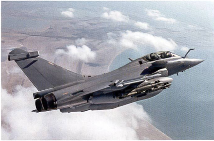
18 Rafale für die griechische Luftwaffe.

Laut griechischen Medienberichten kauft Griechenland für 2,32 Milliarden Euro in Frankreich achtzehn Rafale Kampfflugzeuge. Das Parlament Griechenlands hat dem Kauf dieser Rafale Kampfflugzeugen grünes Licht erteilt. Die Rafale Kampffjets sollen ab dem nächsten Jahr an die griechischen Luftstreitkräfte ausgeliefert werden.