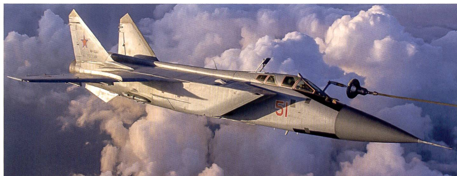
Abschluss der Kampfwertsteigerung von MiG-31BM.