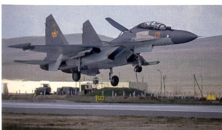
Kasachstan erhält weitere Su-30SM.

Die kasachischen Luftstreitkräfte haben Ende 2020 weitere Su-30SM-Kampfflugzeuge erhalten. Die Su-30SM sind auf dem Luftwaffenstützpunkt Karaganda stationiert, welcher nach Nurken Abdirov, einem Helden der Sowjetunion, benannt ist. Mit den neuen Kampfflugzeugen wurde die Kampfstaffel vervollständigt. Die Übergabe der Kampfausrüstung fand in einer feierlichen Atmosphäre statt. An der Zeremonie nahmen der Verteidigungsminister der Republik Kasachstan, Generalleutnant Nurlan Jermekbajew, der Ober-