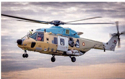
Erstflug des katarischen NH90 TTH.

Sowohl Leonardo Helicopters als auch Airbus Helicopters haben in ihren jeweiligen Werken die ersten NH90 für die Streitkräfte von Katar fertiggestellt und in die Luft gebracht. Hauptauftragnehmer Leonardo wird auch Simulatoren, Training und Maintenance für den Kunden stellen.