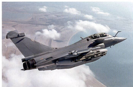
18 Rafale für die griechische Luftwaffe.

Laut griechischen Medienberichten kauft Griechenland für 2,32 Milliarden Euro in Frankreich achtzehn Rafale Kampfflugzeuge. Das Parlament Griechenlands hat dem Kauf dieser Rafale Kampfflugzeugen grünes Licht erteilt. Die Rafale Kampfjets sollen ab dem nächsten Jahr an die grie-