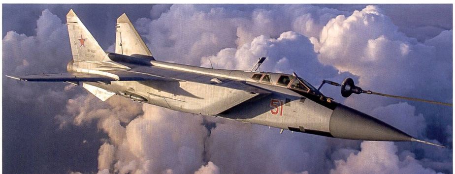
Abschluss der Kampfwertsteigerung von MiG-31BM.