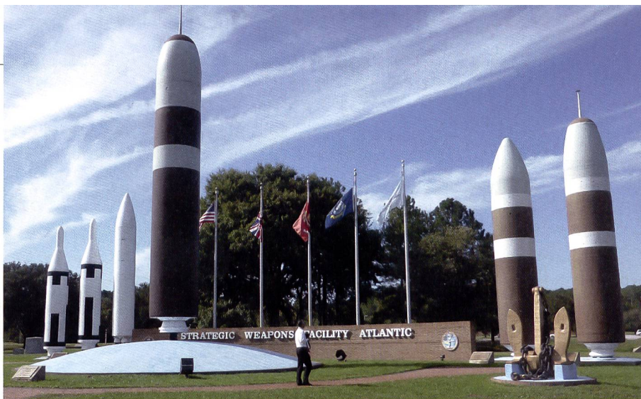
Im Raketenpark des Ubootstützpunktes von Kings Bay (Georgia), dem Heimathafen der an der Ostküste stationierten «Boomer», sind die bisher im Einsatz verwendeten Lenk Waffen ausgestellt. In der linken Bildmitte überragt die «Trident» die früheren «Poseidon» (rechts) und «Polaris» Varianten (links).

Später wurden die 41 «Boomers» durch 18 Einheiten der «Ohio»-Klasse abgelöst, welche zwischen 1984 und 1997 in Dienst gestellt worden sind und die über je 24 Startrohre für ballistische Lenk Waffen des Typs «Trident II D5» verfügen, wobei aus Gründen der Rüstungsbegrenzung nur noch 22 der 24 Abschussrohre belegt sind. Vier dieser Boote wurden nach Unterzeichnung des ersten START Vertrags zwischen den USA und der UdSSR