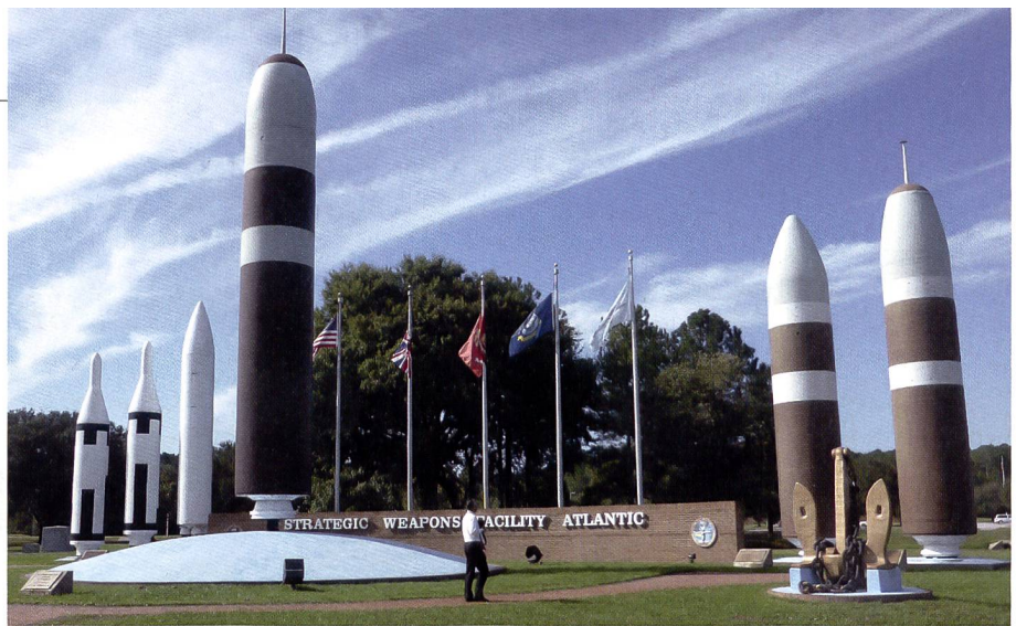
Im Raketepark des Ubootstützpunktes von Kings Bay (Georgia), dem Heimathafen der an der Ostküste stationierten «Boomer», sind die bisher im Einsatz verwendeten Lenk Waffen ausgestellt. In der linken Bildmitte überragt die «Trident» die früheren «Poseidon» (rechts) und «Polaris» Varianten (links).

Später wurden die 41 «Boomers» durch 18 Einheiten der «Ohio»-Klasse abgelöst, welche zwischen 1984 und 1997 in Dienst gestellt worden sind und die über je 24 Startrohre für ballistische Lenk Waffen des Typs «Trident II D5» verfügen, wobei aus Gründen der Rüstungsbegrenzung nur noch 22 der 24 Abschussrohre belegt sind. Vier dieser Boote wurden nach Unterzeichnung des ersten START Vertrages zwischen den USA und der UdSSR