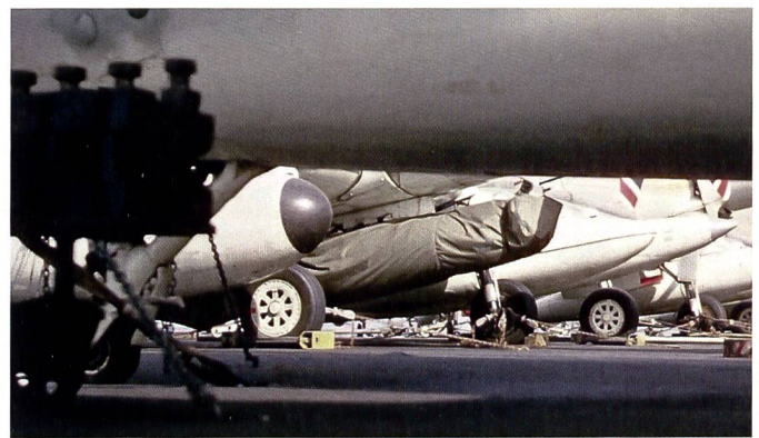
Zur Zeit des Kalten Krieges bis etwa Mitte der 60er Jahre hatten auch die Kampfflugzeuge der US Navy taktische Nukleareinsätze zu fliegen. Auf dieser seltenen Aufnahme auf dem Jahre 1964 ist eine solche Waffe (Mk 7) an einem A-1H «Skyraider» der Attack Squadron 65 auf dem Atomflugzeugträger USS «Enterprise» (CVAN-65) aufgehängt.