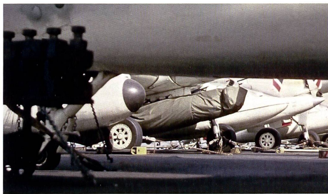
Zur Zeit des Kalten Krieges bis etwa Mitte der 60er Jahre hatten auch die Kampfflugzeuge der US Navy taktische Nukleareinsätze zu fliegen. Auf dieser seltenen Aufnahme auf dem Jahre 1964 ist eine solche Waffe (Mk 7) an einem A-1H «Skyraider» der Attack Squadron 65 auf dem Atomflugzeugträger USS «Enterprise» (CVAN-65) aufgehängt.