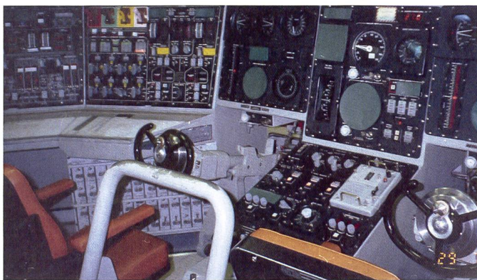
Die Steuerkonsole auf dem ballistischen Lenk Waffenuboot USS «Maine» (SSBN-741), dem drittneuesten «Boomer» der «Ohio»-Klasse. Das Boot wurde 1995 in Dienst gestellt. Links ist der Arbeitsplatz des Tauch-Rudergängers (Tiefensteuerung – planesman), rechts jener des Rudergängers (Seitensteuerung – helmsman).

Mit jedem Neuzugang eines «Columbia»-Bootes wird eine Einheit der «Ohio»-