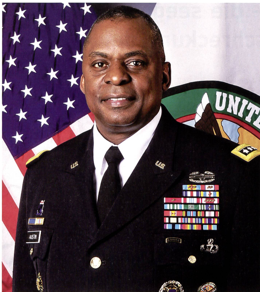
General Lloyd Austin III.

Danach wurde er als Dreisterngeneral Kommandant des XVIII Luftlandekorps und diente wiederum im Irak. Von 2009 bis 2010 war er Direktor des Vereinten Stabes im Pentagon. Danach wurde er, be-