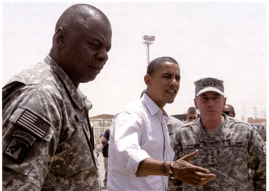
Austin, Obama und Petraeus.

Als Infanterieoffizier diente er u.a. bei der 3. Infanteriedivision in Deutschland, dann bei der 82. Luftlandedivision in Ft. Bragg. Dort war er als Brigadegeneral Kommandant der 3. Brigade. Dieser Verwendung folgte eine Abkommandierung in den Joint Staff (J-3) ins Pentagon. In der Operation «Iraqi Freedom» war er 2001 bis 2003 Stellvertretender Divisionskommandant der 3rd Infantry Division, danach kommandierte er die 10. Gebirgsdivision in Fort Drum, New York. In dieser Funktion stand er auch in der Operation «Enduring Freedom» in Afghanistan im Einsatz (2003–2005).