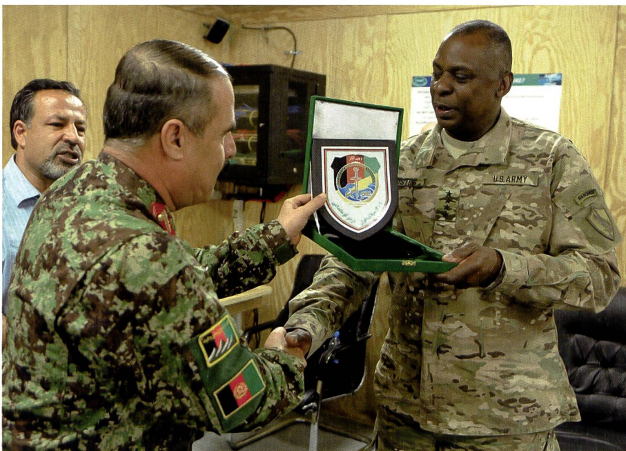
In Afghanistan: Generalmajor Zaman und General Austin.

fördert zum Viersterngeneral, Stellvertreter Stabschef des Heeres, von wo er dann 2013 auf den Posten des Commander US Central Command berufen wurde.