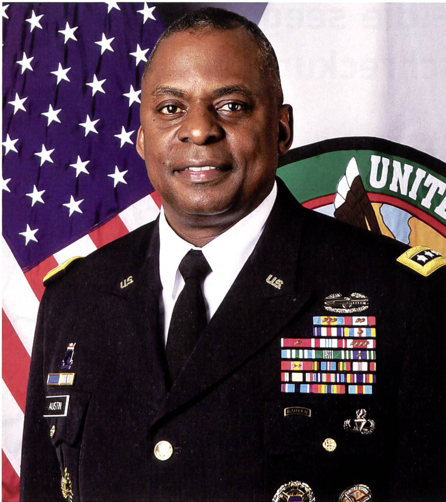
General Lloyd Austin III.

Danach wurde er als Dreisterngeneral Kommandant des XVIII Luftlandekorps und diente wiederum im Irak. Von 2009 bis 2010 war er Direktor des Vereinten Stabes im Pentagon. Danach wurde er, be-