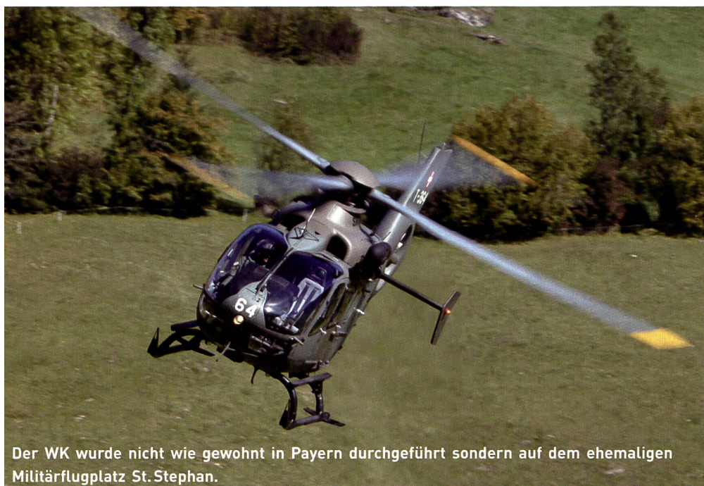
Der WK wurde nicht wie gewohnt in Payerne durchgeführt sondern auf dem ehemaligen Militärflugplatz St. Stephan.