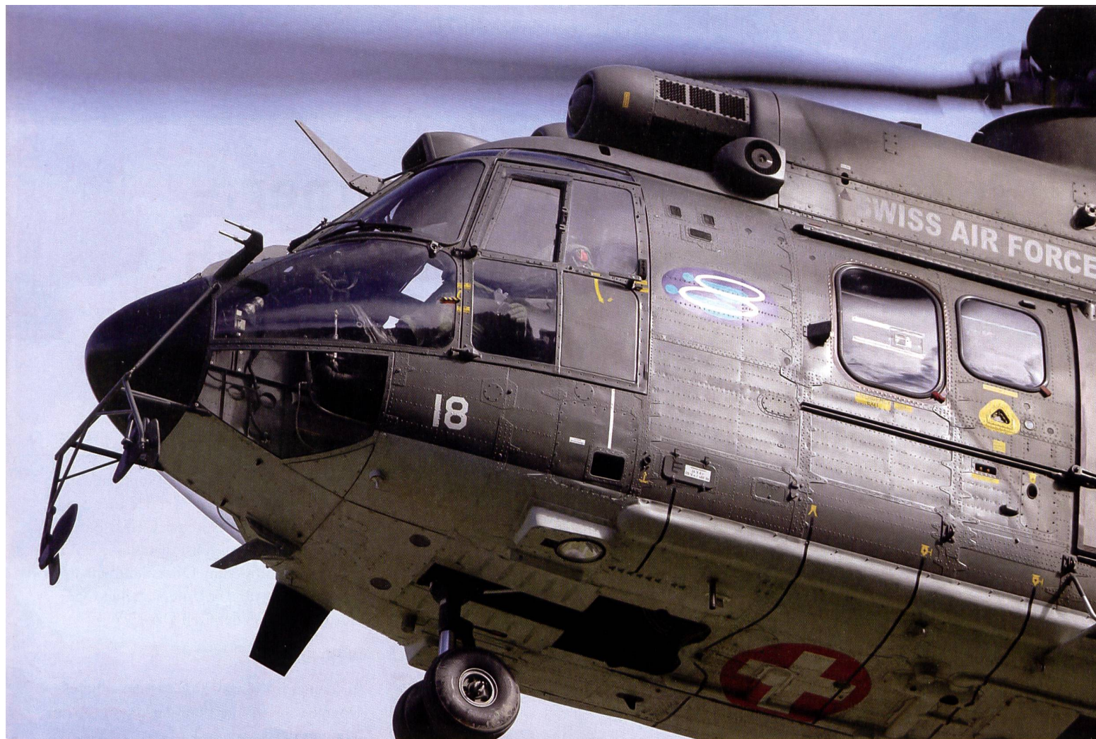
Das Kommando beinhaltet zwei Staffeln im WK: Die Lufttransport Staffeln 1 und 5.