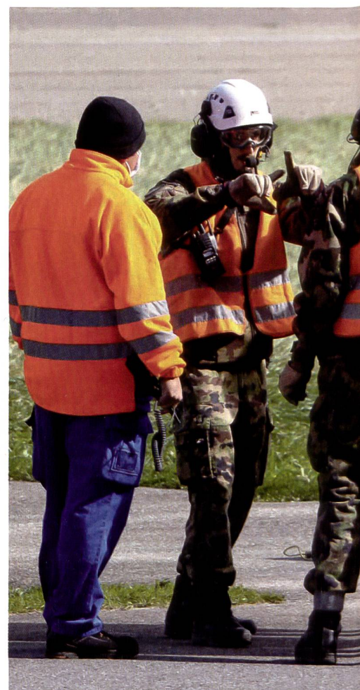
Nach der Mobilmachung gemeinsam im Einsatz: