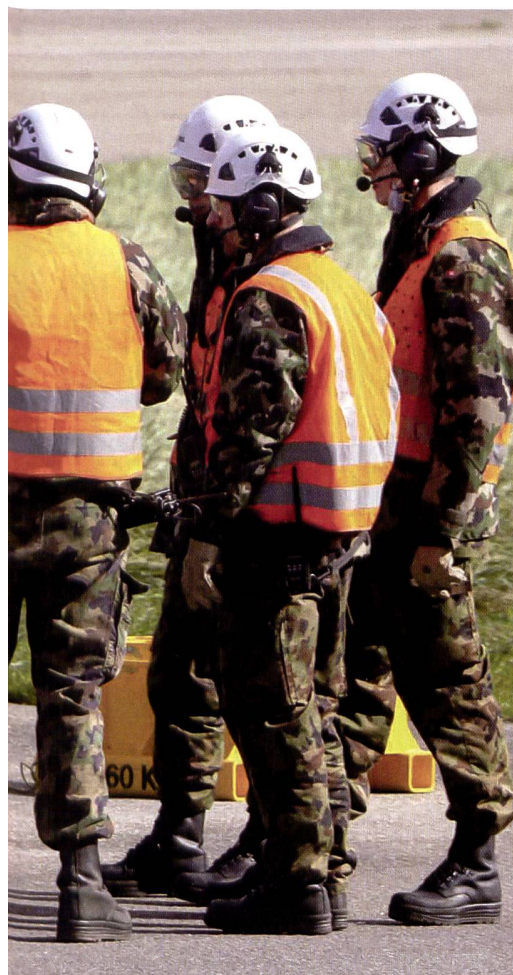
Berufspersonal und Milizangehörige.