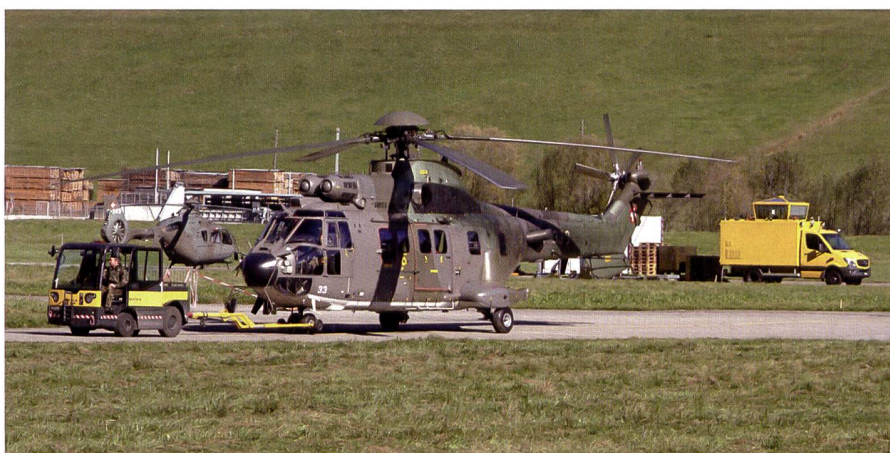
Die benötigte Infrastruktur wurde von der Truppe eigens für den WK aufgebaut.