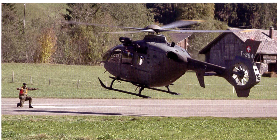
Das LT Kdo 1 ist bereit seine Aufträge auch nach einer Mobilmachung zeitgerecht zu erfüllen.