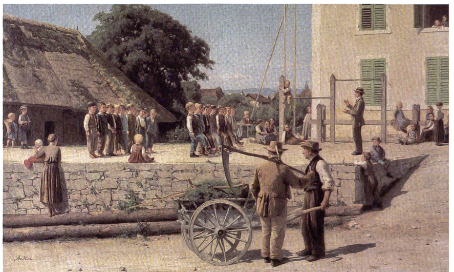
«Die Turnstunde» von Albert Anker.