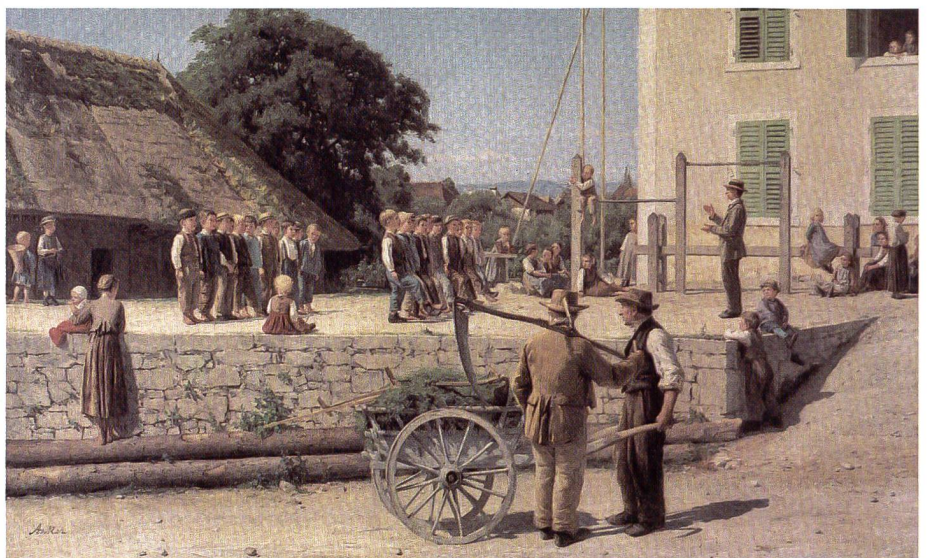
«Die Turnstunde» von Albert Anker.