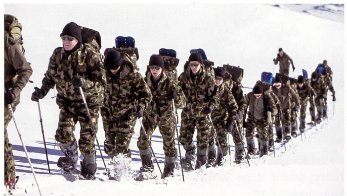
Sport in der Armee dient nicht primär der Auflockerung oder dem Kopflüften, sondern ist auf den militärischen Einsatz ausgerichtet.