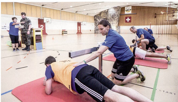
Die Sportausbildung richtet sich dabei auf beide Komponenten aus – Berufsmilitär und Miliz.