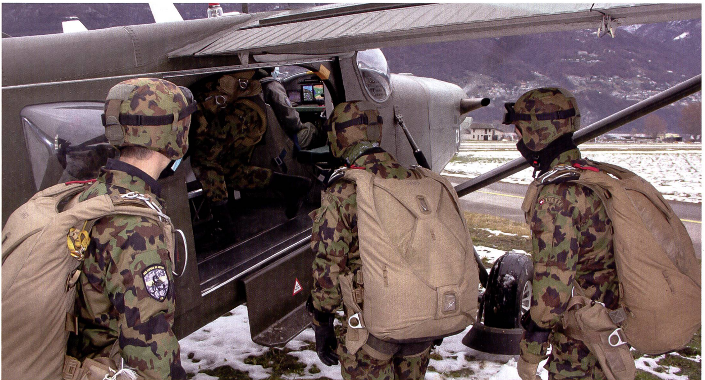
Die Fallschirmaufklärer beschaffen Nachrichten zugunsten des Kommando Spezialkräfte und der operativen Führung der Armee.