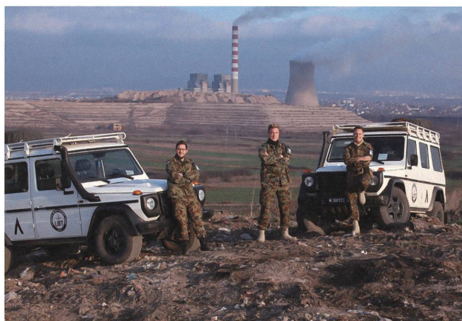
Insgesamt 4 LMT-Teams erfüllen trotz COVID-Restriktionen ihren Auftrag und suchen den Dialog mit der Bevölkerung.