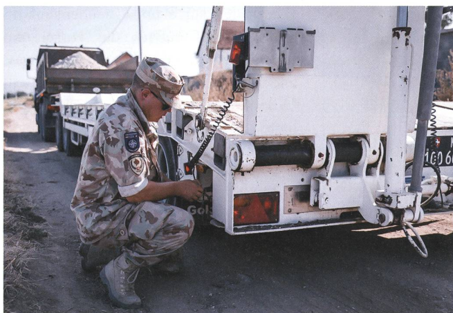
Der Einsatz des 43. Swisscoy Kontingents neigt sich dem Ende zu.