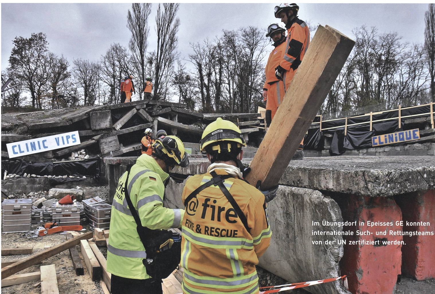
Im Übungsdorf in Epeisses GE konnten internationale Such- und Rettungsteams von der UN zertifiziert werden.

Ursprünglich als reine Hilfsorganisation nach Erdbeben entwickelt, dienen die INSARAG-Richtlinien heute als Basis für nahezu alle Soforthilfemassnahmen seitens der UNO. Um die richtigen Leute am richtigen Ort einsetzen zu können, müssen sich die angeschlossenen Teams zerti-