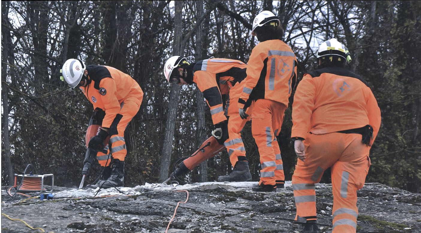
Das Schweizer Team bei der Arbeit.

fizieren lassen. Die entsprechende Klassifizierung soll auch den von Katastrophen betroffenen Ländern bei der Wahl der Hilfsangebote helfen. Bisher wurden über 50 internationale Teams im Bereich «urbane Ortungs- und Rettungseinheiten» klassifiziert.