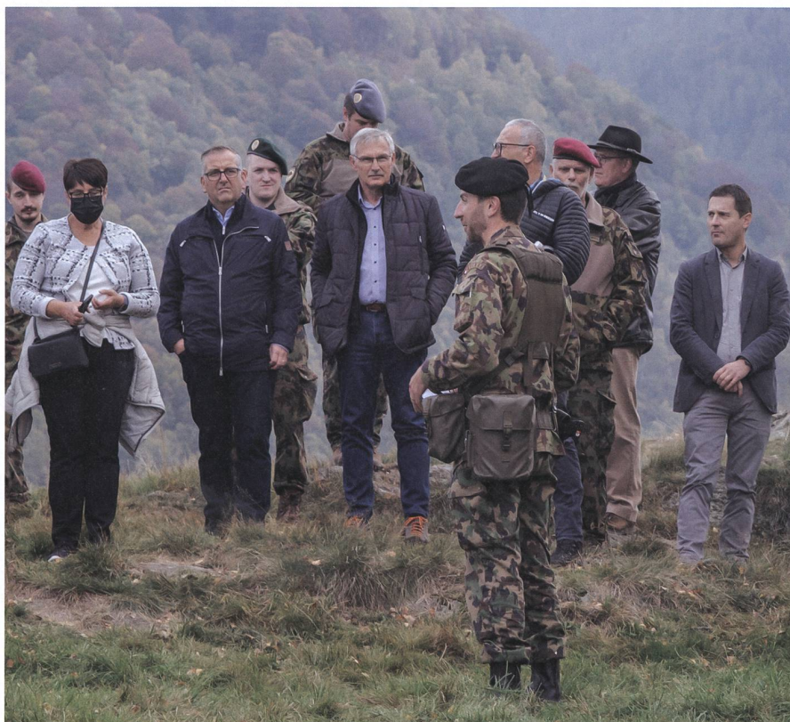
Die Schwyzer Kantonsregierung zu Besuch beim Geb Inf Bat 29.