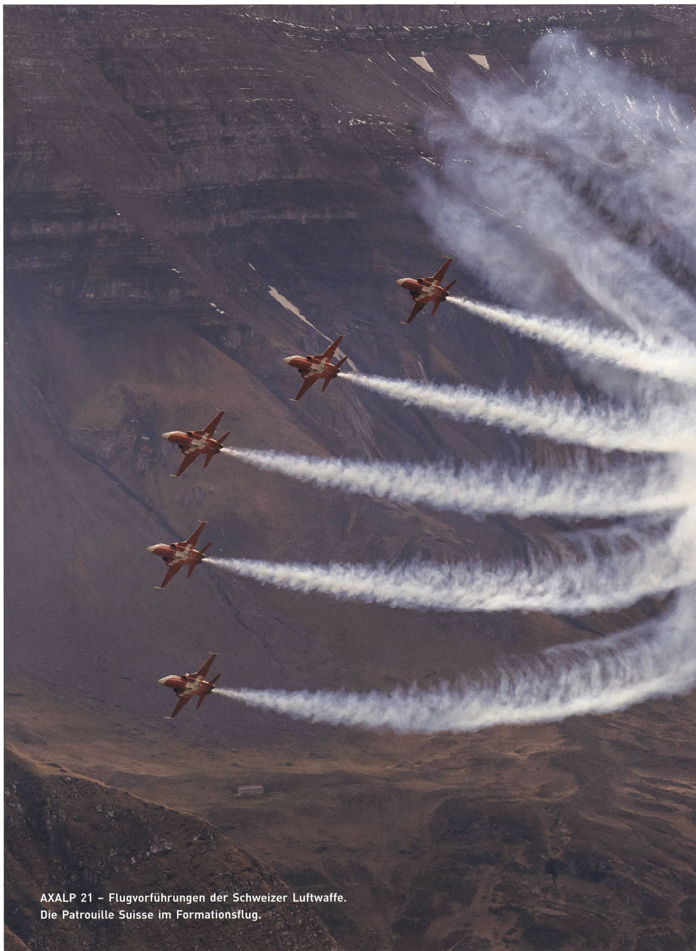
AXALP 21 – Flugvorführungen der Schweizer Luftwaffe. Die Patrouille Suisse im Formationsflug.