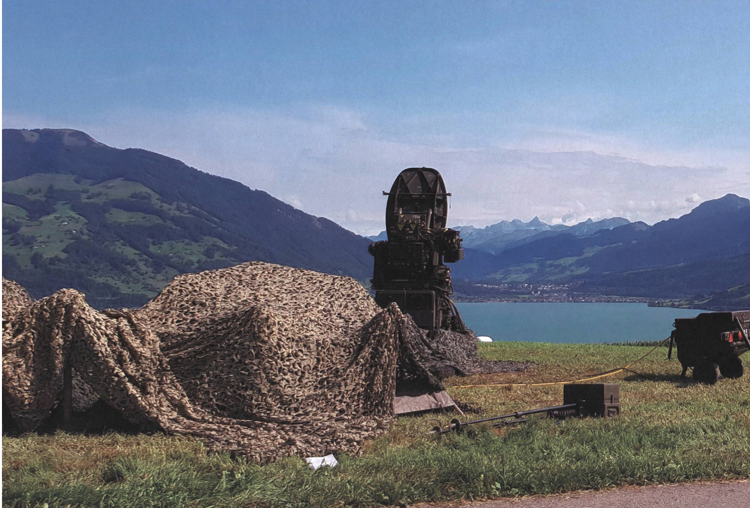
Eine Feereinheit Rapier in Stellung.