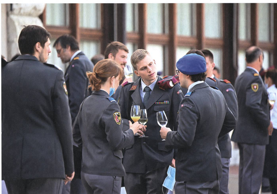
124 Offiziere wurden dieses Jahr durch ihren Heimatkanton begrüsst.