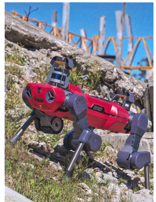
ANYmal: Kein Weg zu schwierig, kein Hindernis zu komplex.