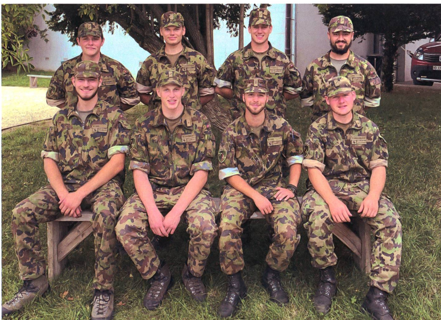
Rettungsgruppe Sari: Unterstützer und vielleicht auch Vorbilder der Rettungsroboter?

Sie kann von internationalen Studierenden zusätzlich zum Studium als ergän-