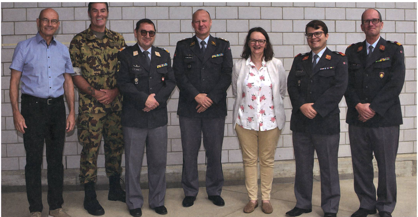
Bilder: Josef Rittler