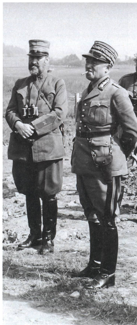
Guisan auf Truppenbesuch.

Nach meiner Überzeugung ist das «Réduit» viel mehr als eine militärische