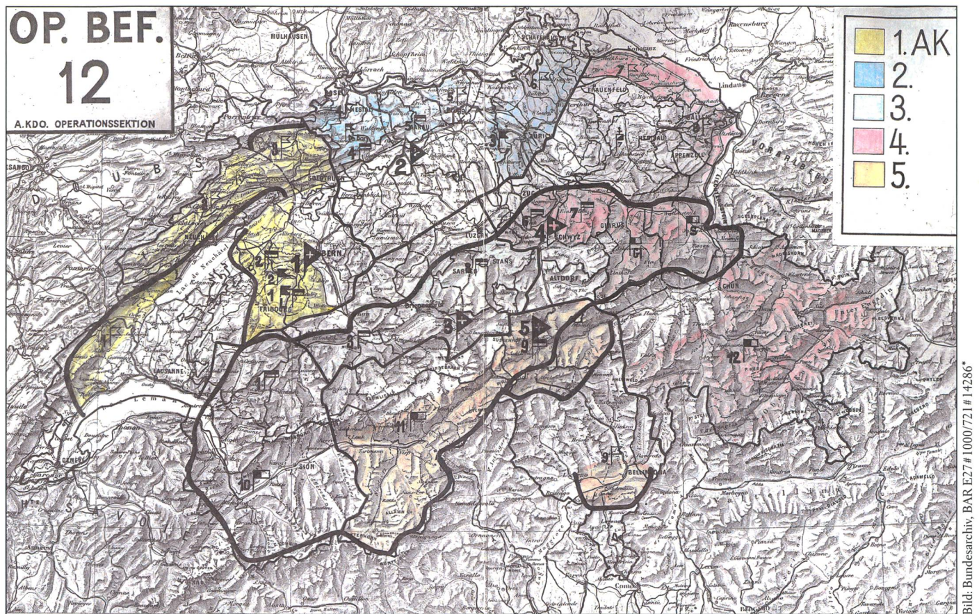
Die Kartenbeilage Nr. 4 zum Op Bef Nr. 12 mit den zugewiesenen Räumen. Die Rundumbedrohung hat diese Situation erzwungen.

Treffen-Lösung» auf der Grundlage Strüby auszuarbeiten. Als Änderungen befahl er, dass die Städte Thun und Luzern nicht in den Zentralraum einzubeziehen seien, jedoch die Festung Sargans. Der Westflügel der vorgeschobenen Stellung sei an die Saane zu legen und die Südfront im Wallis an die Landesgrenze.