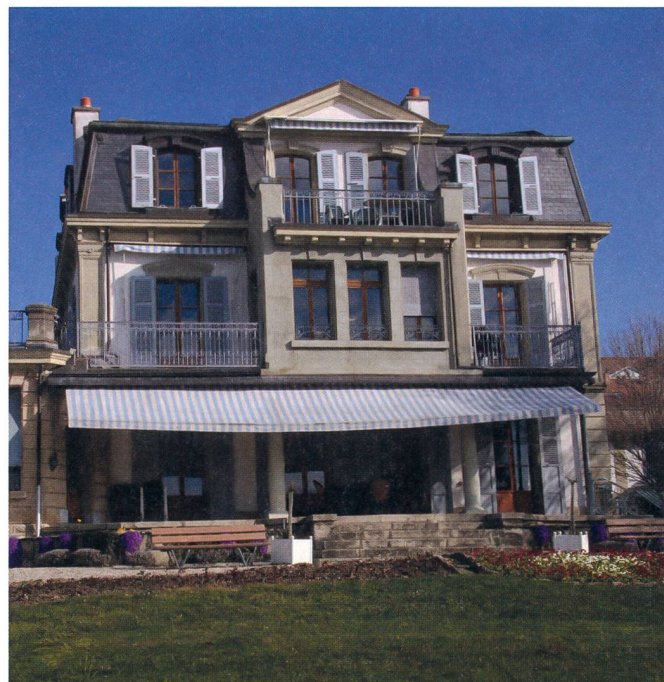
Verte Rive in Pully : Arbeits- und Wohnort von General Henri Guisan.