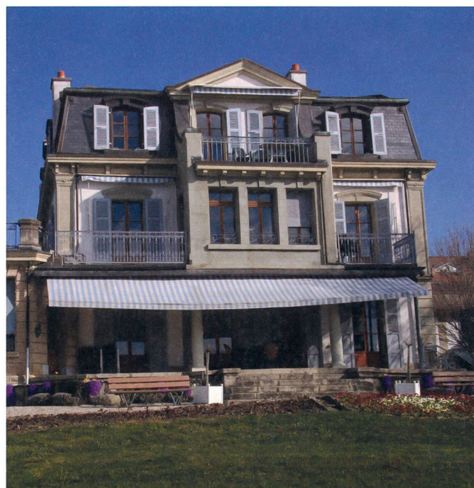
Verte Rive in Pully : Arbeits- und Wohnort von General Henri Guisan.