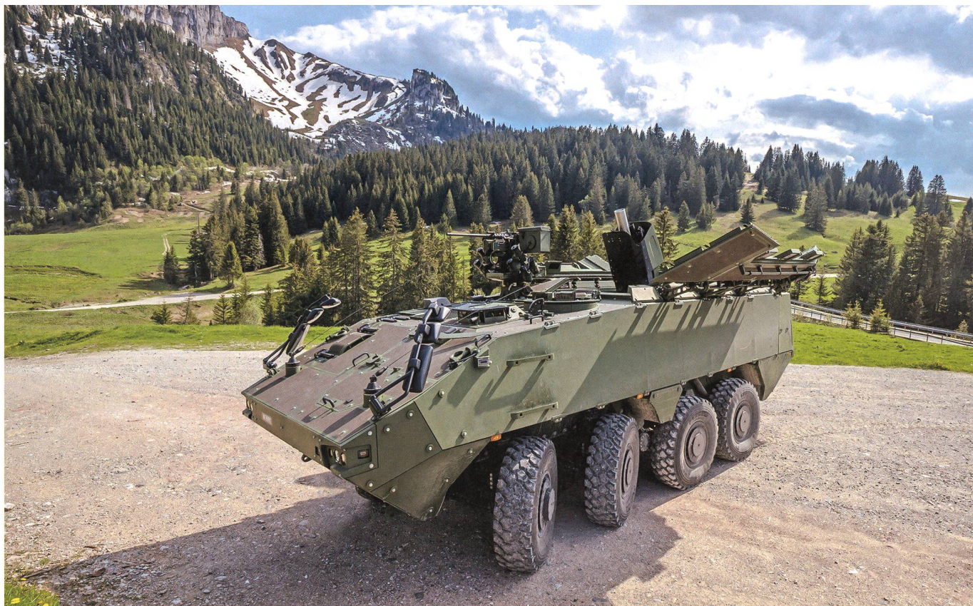
Das Gesamtpaket umfasst 32 Mörsersysteme (Trägerfahrzeug und Geschütz).