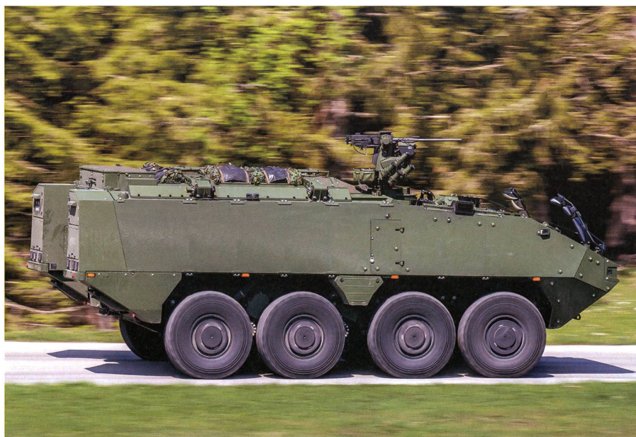
Die Kriterien für eine Truppentauglichkeit sind erfüllt und der Nachweis für den Einsatz in der Armee ist erbracht.

Das Geschütz ist eine Entwicklung der Ruag Schweiz AG. Sie operiert heute unter dem Namen MRO Schweiz (MRO: Maintenance, Repair, Operation). Als Trägerfahrzeug wurde der Piranha IV der Firma General Dynamics European Land Systems-Mowag GmbH in Kreuzlingen vorgeschlagen. Die Mörser 16 sollten im Zeitraum der Jahre 2018 bis 2022 ursprünglich ausgeliefert werden.