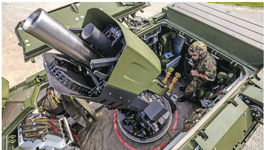
Das Waffensystem verschießt 120mm Granaten mit einer Distanz von bis zu 9 km.