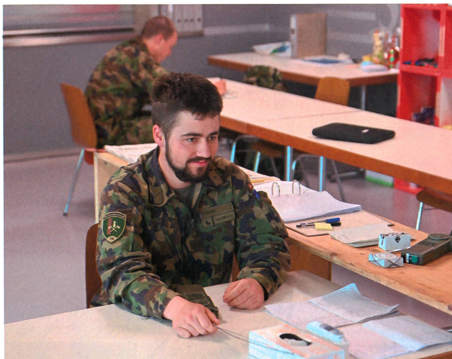
Trotz Entbehrungen- Die Motivation blieb hoch: Soldaten der Rttg Schule im Kp.

Kaum im Einsatz, war die Urlaubssperre kein Thema mehr. Die Truppe freute sich auf die bevorstehende Aufgabe, auch wenn diese nicht ganz einfach für die Männer und Frauen in Uniform war, wie sich später herausstellte.