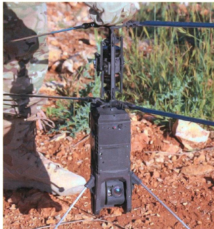
Neuartige »Schwebemunition« «FireFly» für die IDF.

Das israelische Verteidigungsministerium will die schwebefähige (loitering) Munition «FireFly» beschaffen. Loitering Munition wird ohne konkretes Ziel gestartet und kann begrenzte Zeit in der Nähe möglicher Ziele schweben, bis die Wirkung ausgelöst wird. Die gemeinsam von Rafael und dem Verteidigungsministerium entwickelte FireFly wiegt nur drei Kilogramm und bietet dem abgesessenen Soldaten die Fähigkeit zum Präzisionsangriff hinter der