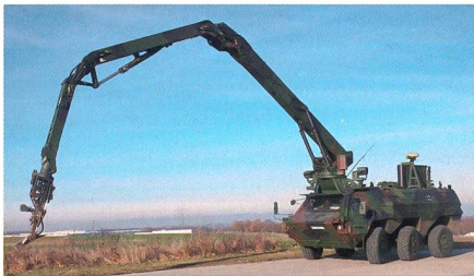
Neue KAMIR-Variante des Radpanzers Fuchs.

Der modifizierte Transportpanzer ist eine Ergänzung des deutsche Route Clearance Systems, eines Fahrzeugverbunds, welcher sowohl der Detektion als auch dem Räumen von unter der Strassenoberfläche verbrachten IED dient. Um auch Fahrbahnrandbereiche und schwer zugängliche Stellen auf eine IED-Bedrohung hin untersuchen zu können wurde der Fuchs KAI entworfen. Es handelt sich