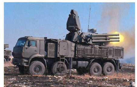
Panzir S1 für die serbischen Streitkräfte.