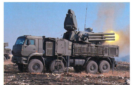
Panzir S1 für die serbischen Streitkräfte.