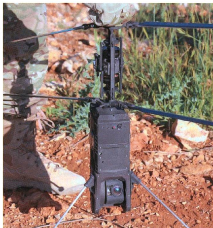
Neuartige »Schwebemunition« «FireFly» für die IDF.

Das israelische Verteidigungsministerium will die schwebefähige (loitering) Munition «FireFly» beschaffen. Loitering Munition wird ohne konkretes Ziel gestartet und kann begrenzte Zeit in der Nähe möglicher Ziele schweben, bis die Wirkung ausgelöst wird. Die gemeinsam von Rafael und dem Verteidigungsministerium entwickelte FireFly wiegt nur drei Kilogramm und bietet dem abgesessenen Soldaten die Fähigkeit zum Präzisionsangriff hinter der