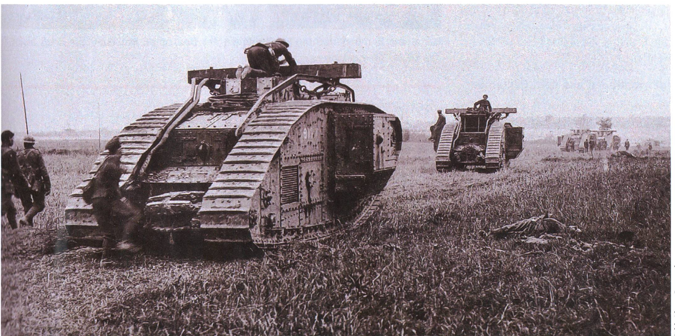
Tank Mark V, 5. Tank-Brigade auf dem Vormarsch Richtung Villers-Bretonneux, August 1918.

Der Auftakt sollte am Fluss der Somme, bei Amiens, einer Ortschaft westlich von St. Quentin, durch die Briten erfolgen. Im Rahmen der Michael-Offensive im Frühjahr 1918 stoppten britische und australische Verbände den deutschen Vormarsch vor Amiens. Es entstand eine 32 Kilometer lange Frontlinie von Albert über Villers-Bretonneux nach Moreuil. Dabei baute die deutsche Armee Amiens zu einer wichtigen Versorgungsdrehscheibe aus.