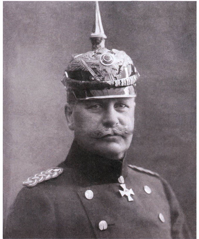
General Georg von der Marwitz (1856 - 1929).

linie ohne längere Artillerie-Vorbereitung zu ermöglichen.