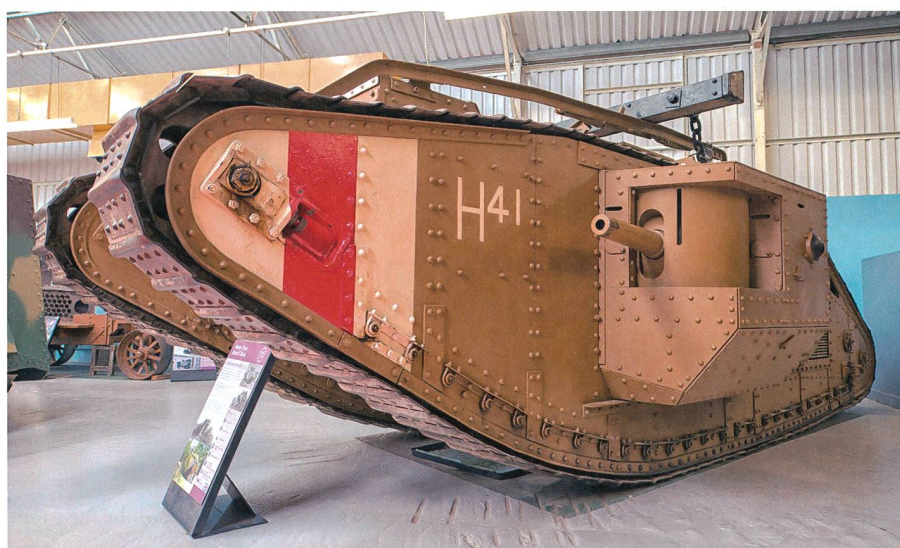
Tank Mark V (Male), weltweit noch zehn Exemplare vorhanden, ausgestellt im Tank Museum in Dorset, England.

Trotz Rückzug der deutschen Armee auf die Hindenburg-Linie, warteten Hindenburg und Ludendorff bis sie die militärischen Konsequenzen aus den Niederlagen zogen. Erst im November 1918 schwiegen die Waffen. +