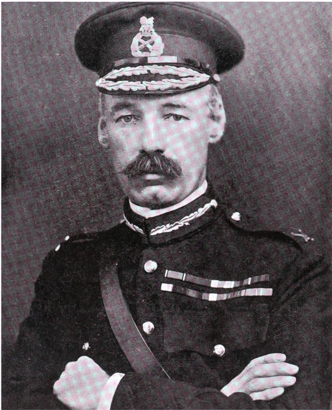
General Henry Rawlinson (1864 - 1925).