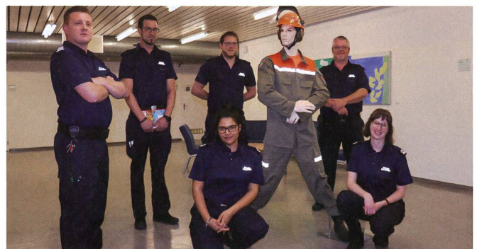
Koordinieren von hier aus den Einsatz: Stab der ZSO Basel-Stadt.