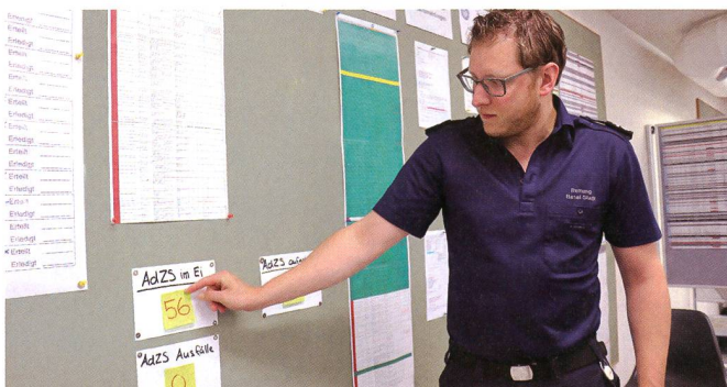
Stets den Überblick behalten: An diesem Tag waren 56 AdZS im Einsatz.

Im Einsatz während der Coronakrise in Basel zeigte sich, was so nur der Zivilschutz kann. Innert kürzester Zeit bekamen die Gesuchsteller die benötigte Hilfe. Je nach Zivilschutz-Funktion oder nach beruflichem Werdegang, konnten gezielt die richtigen Personen gefunden werden. Nach einem Vorbereitungskurs nahmen die Zivilschützer ihre Aufträge unter Anweisung des Personals vor Ort wahr. Das Pflegeheim «neues Marta Stift» gehört zu den Betrieben, welche ein Hilfesuch