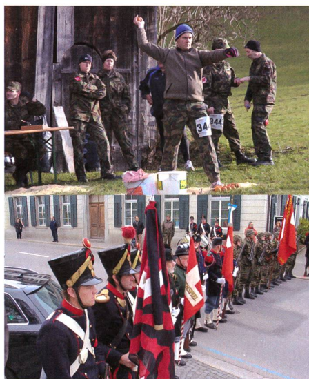
Die Vielfalt der Angebote der ausserdienstlichen Tätigkeit ist sehr gross und ebenso vielfältig.