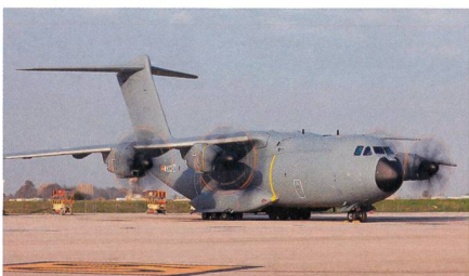
Erstflug der luxemburgischen A400M.

Im April absolvierte der erste Airbus A400M Transporter für Luxemburg seinen erfolgreichen Jungfernflug. Bei dem ersten Airbus A400M für die Streitkräfte Luxemburgs handelt es sich um die Baunummer MSN104. Luxemburg hat einen A400M gekauft und wird das Flugzeug zusammen mit Belgien betreiben; der A400M Transporter soll noch im 2. Quartal 2020 an Luxemburg ausgeliefert werden. Die A400M von Belgien und Luxemburg werden durch das 15. Air Transport