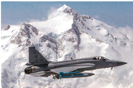
JF-17 der pakistanischen Luftwaffe.

Bereits Ende letztes Jahr fand der Erstflug des ersten Prototyps der jüngsten Block 3-Version des chinesisch-pakistanischen Kampfflugzeuges PAIC JF-17 statt, wie nun bekanntgeworden ist. Mit der Weiter-