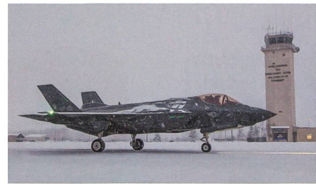
F-35 wird in Alaska stationiert.

Die ersten beiden Lockheed Martin F-35A Lightning II für die Pacific Air Forces sind kürzlich auf der Eielson AFB gelandet, teilte die US Air Force mit. Die Flugzeuge sind für die kürzlich reaktivierte 356th Fighter Squadron bestimmt, welche Teil des 354th Fighter Wing ist. Insgesamt sollen in Eielson bis Dezember 2021 54