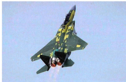
Erstflug der F-15QA.

Katar hat in den Vereinigten Staaten im Jahr 2017 für 6,2 Milliarden US-Dollar F-15 in Auftrag gegeben. Bei der F-15QA handelt es sich um die modernste F-15, sie basiert auf der F-15SA, diese wurde wiederum für Saudi-Arabien aus der modernsten F-15E Strike Eagle weiterentwickelt. Die F-15QA ist mit dem weltweit schnellsten Waffen- und Missionsrechner ausge-