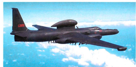
Aufklärungsflugzeug Lockheed Martin U-2 Dragon Lady.