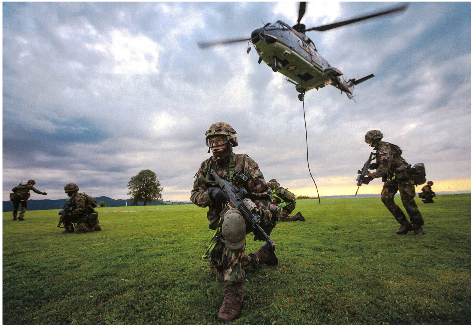
Heute ist Isonne das Ausbildungszentrum aller Spezialkräfte der Armee. Dazu gehört auch das Armee-Aufklärungsdetachment 10, die Grenadierbataillone 20 und 30, das MP Spezialdetachment und die Fallschirmaufklärungskompanie 17. Das Auswahlverfahren ist streng, die RS dauert 23 Wochen.

mittel, Seilmaterial, Funkgeräte, Geländefahrzeuge und neutrale Personenwagen sowie Alouettes III Helikopter bereit.