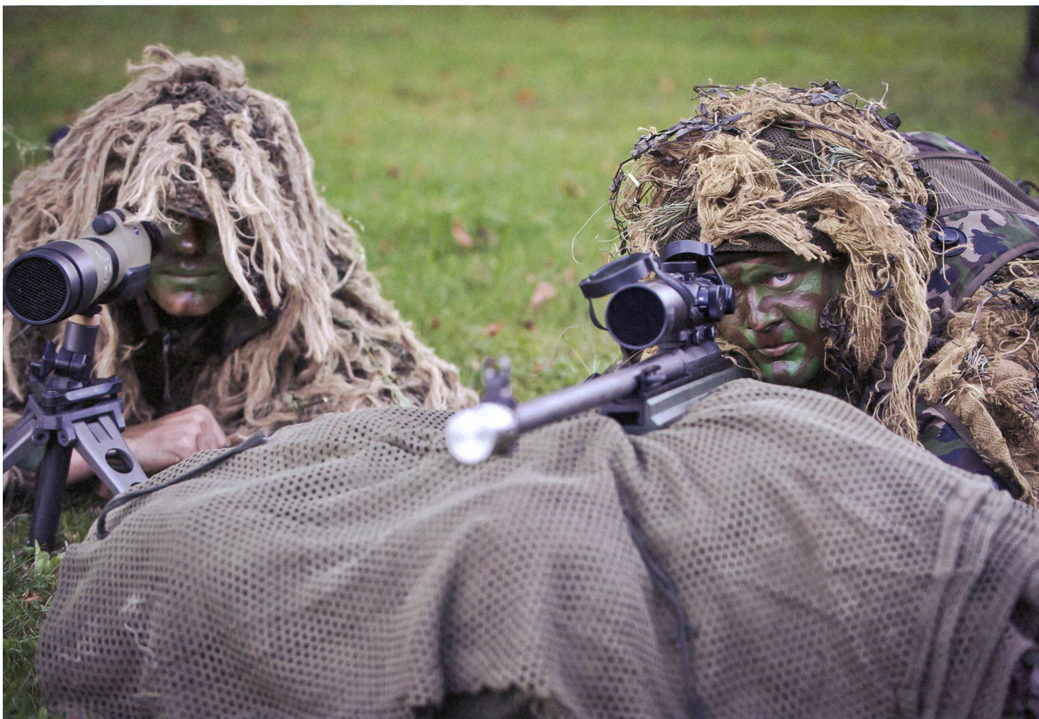
Scharfschützen der Armee und der Polizei verfügen praktisch über die gleiche Ausrüstung und Tarnung.

Landesregierung und deren nächste Angehörige im Krisenfall vor direkten Angriffen schützen. Die über 100 militärischen Personenschützer, Männer und Frauen, gehören bis heute allesamt zivilen Polizeikorps an. Sie müssen bei der Umteilung in die Armee Angehörige einer Sondereinheit sein. Jetzt heisst die Truppe Militärpolizei-Schutzdetachement.