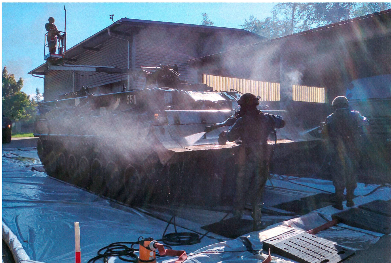
Dekontamination eines Panzers.

Die Schweiz gehört zu den Unterzeichnern des «Atomwaffenverbotsvertrags». Sie verpflichtet sich deshalb, weder Atomwaffen einzusetzen, noch welche zu entwickeln oder zu besitzen. International sind biologische und chemische Waffen verboten. Sie sind aber genauso wie atomare Waffen im Besitz verschiedener Staa-