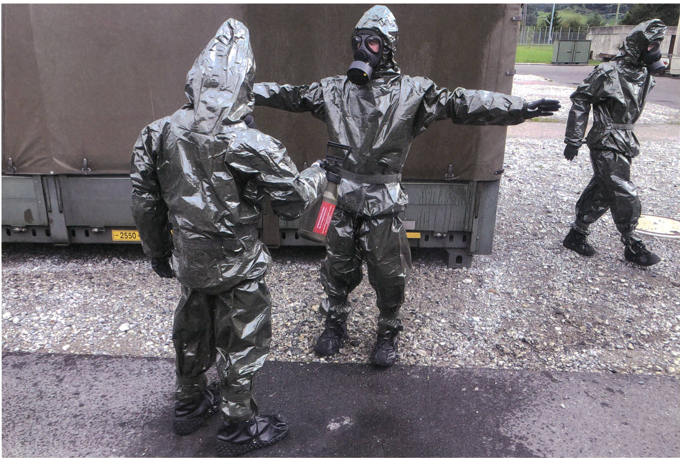
Kameradschaft: Gegenseitige Kontamination.

ten. Für die Schweizer Armeeangehörigen bedeutet dies, im ABC-Schutz ausgebildet zu sein, falls der Gegner solche Waffen einsetzen würde. Während einer Woche im September 2019 durchliefen wir in Spiez einen vertieften Unterricht, welcher durch ABC-Fachspezialisten vermittelt wurde. Wissenschaftler, wie auch andere Fachlehrpersonen, stellten die Bedeutung einer solchen Schutzausbildung dar und betonten, dass die ABC-Bedrohung höher einzustufen ist, wie wir vielleicht zu glauben meinen.