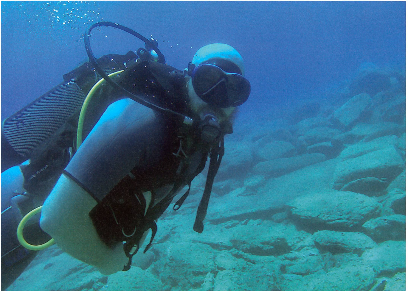
In der Freizeit: Auf Tauchgang.

nicht alltagstauglich, aber ich bin überzeugt von deren grossen Nutzen, insbesondere was die Informationsbeschaffung angeht.