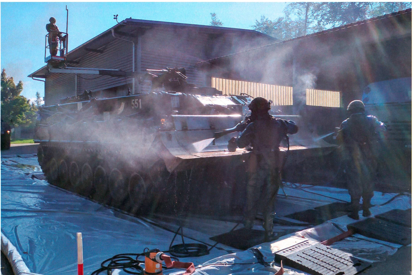
Dekontamination eines Panzers.

Die Schweiz gehört zu den Unterzeichnern des «Atomwaffenverbotsvertrags». Sie verpflichtet sich deshalb, weder Atomwaffen einzusetzen, noch welche zu entwickeln oder zu besitzen. International sind biologische und chemische Waffen verboten. Sie sind aber genauso wie atomare Waffen im Besitz verschiedener Staa-