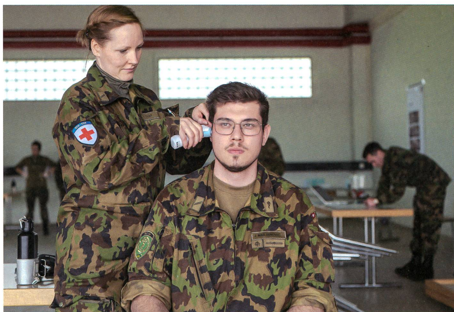
Eine AdRKD beim Fiebermessen anlässlich der Mobilmachung.

Zusätzlich waren Medizinstudentinnen des RKD mit verschiedenen Aufgaben im Einsatz. Sie gewannen so wertvolle Praxiserfahrung für ihre berufliche Zukunft.