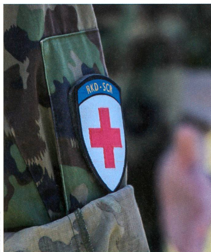
Bis zu 70 Angehörige des Rotkreuzdienstes waren gleichzeitig im Einsatz.