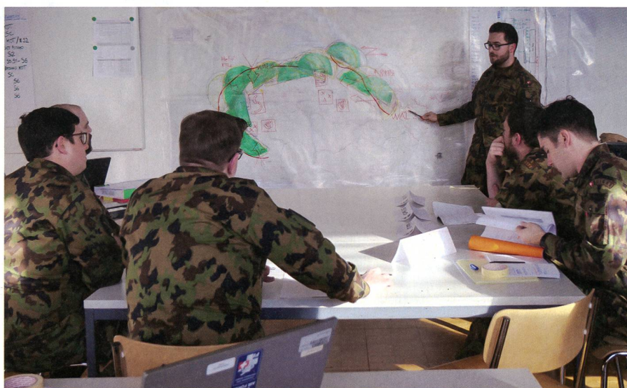
Lagerappart: Der Nachrichtenoﬃzier bei der Präsentation.