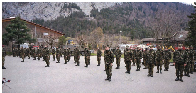
AV der ABC Abw Lab Kp 1/1 unter Einhaltung der Abstands-Vorschriften.

Seit Anfang April hat sich die Lageentwicklung kontinuierlich verlangsamt. Zur