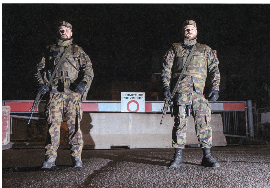
Geschlossen: Ein Soldat und ein Zugführer an der Grenze.