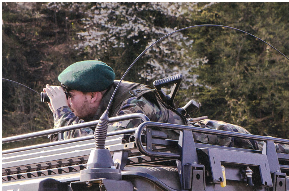
Ein AdA überwacht das Gelände im Grenzraum.