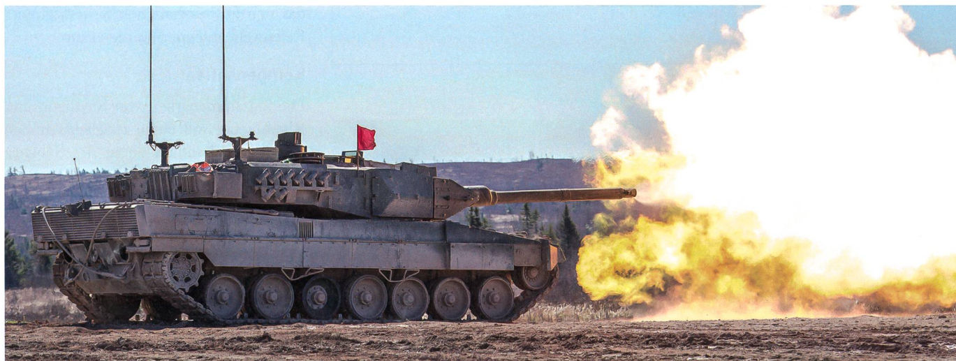
100 Jahre Panzerentwicklung – Darunter auch die Geschichte des M1 Abrams.