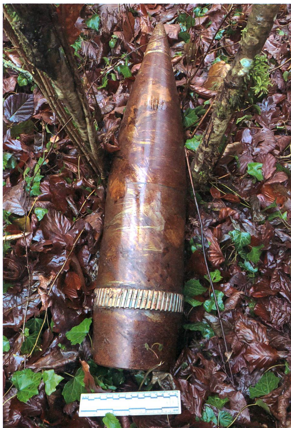
Die 155mm Artilleriegranate.