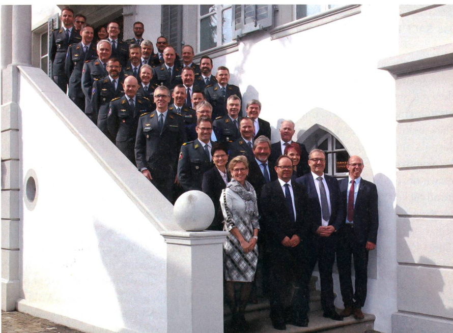
Zahlreiche Teilnehmer am Anlass der Kantone Ob- und Nidwalden.